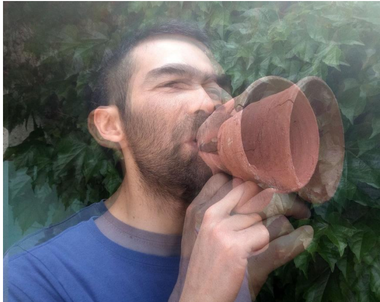
Figura 1. Barro Local, 2020. Alta voz de barro - registro de performance.

De esta manera, este proyecto propone un diálogo desde una mirada ampliada de la cerámica, retomando formas y conceptos de los antiguos pobladores de la zona, a través de diversas acciones e investigaciones, ya sean artísticas, matéricas, cerámicas, arqueológicas e históricas, con el objetivo de generar un conocimiento vivencial y relacional del territorio, vinculando a los habitantes que, a través del tiempo, han vivido en esta zona, desde los querandíes hasta la actualidad.