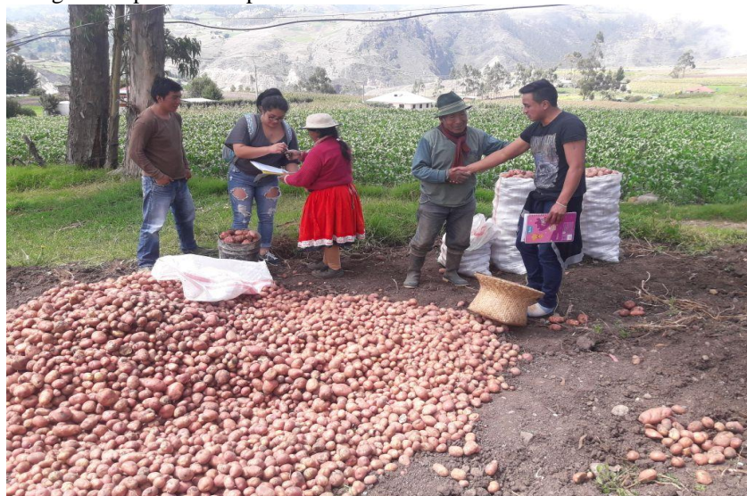
Gráfico 2. Actividades agrícolas practicadas por miembros de las comunidades

Se demuestra la realidad socio- económica actual de las comunidades del cantón El Tambo en el que la actividad laboral por excelencia es la agricultura seguida de la ganadería y el comercio (Artesanía, Turismo), se denota una despreocupación institucional pues alrededor del 67% labora de manera independiente, el 28% tiene negocio propio y el 5% no posee negocio ni labora en forma independiente.