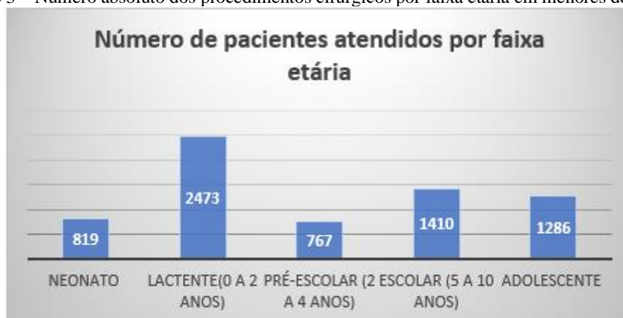
Gráfico 3 – Número absoluto dos procedimentos cirúrgicos por faixa etária em menores de 14 anos