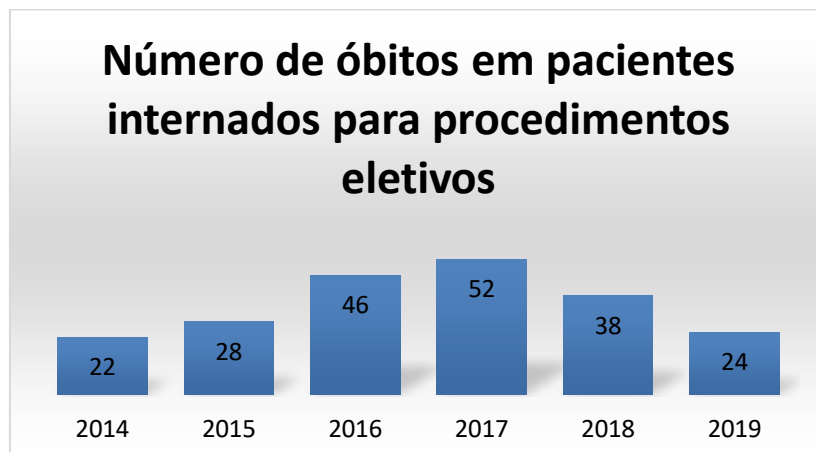
Gráfico 4 – Número absoluto de óbitos em pacientes submetidos a procedimentos cirúrgicos em menores de 14 anos