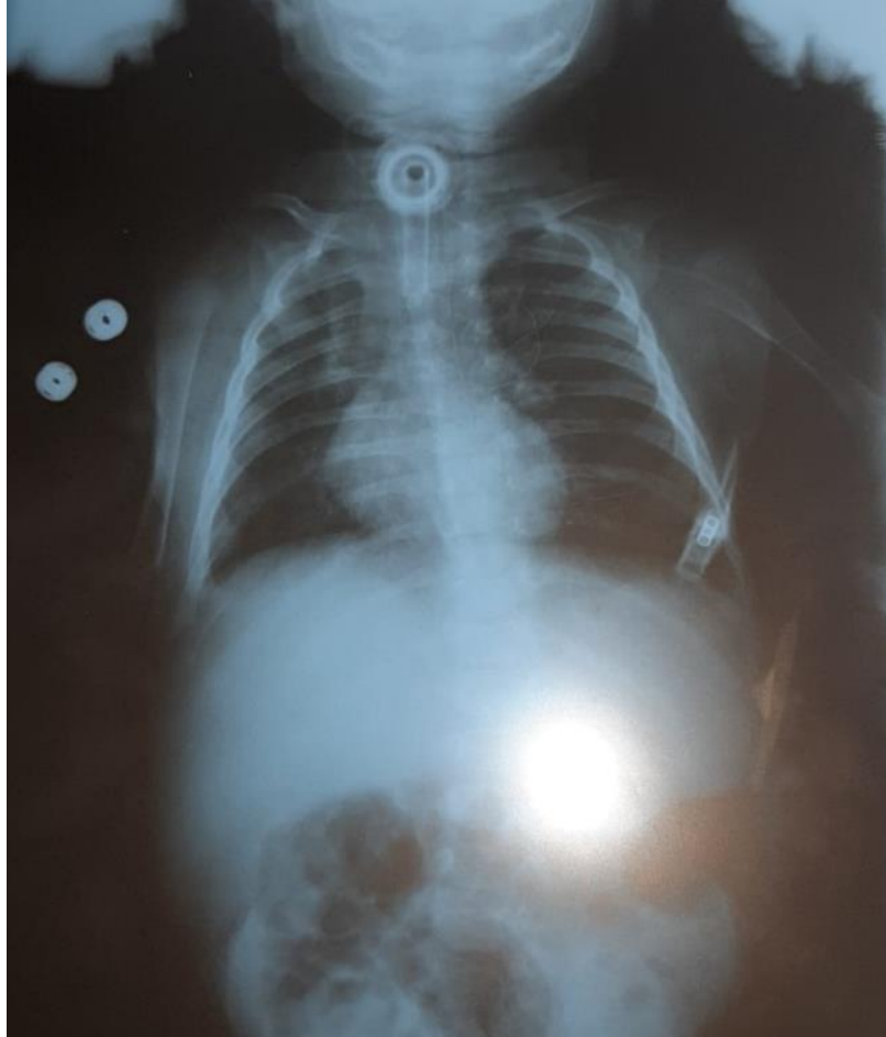
Imagem 1: Radiografia de tórax com radiopacidade em ápice de pulmão direito

Apresentou quadro de derrame pericárdico com melhora ao longo da internação, provavelmente atribuído ao quadro infeccioso, bem como taquicardia (>180 bpm) intermitente sem repercussão hemodinâmica. Percebida trombose de veia femoral direita pós AVC em ultrassom, com presença de edema unilateral em membro inferior direito, que regrediu de forma lenta e progressiva durante evolução. Solicitado ecocardiograma, que demonstrou uma pequena persistência do canal arterial, forame oval patente e leve derrame pericárdico. Após dois meses de acompanhamento do ECO, esse se apresentou dentro dos limites de normalidade. Além disso, foi observada hepatomegalia e aumento de transaminases, realizada ultrassonografia de abdome total que verificou hepatomegalia moderada homogênea, inespecífica. Devido a melhora progressiva ao longo da internação, sugerido hepatite transinfecciosa.