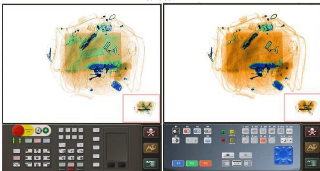
Figura 7: Imagem da mesma bagagem simulada em diferentes equipamentos de raios X

reproduzido fielmente pelo software de forma que o treinando possa selecionar e utilizar os mesmos comandos e funções presentes num equipamento de raios X real, como pode ser visto na Figura 7. Ainda na Figura 7, pode-se verificar que a imagem da mesma bagagem simulada por diferentes equipamentos podem apresentar a classificação dos objetos em gradação de cores diferentes. Isto denota a relevância da capacitação dos profissionais nos equipamentos que efetivamente serão utilizados no ambiente real de inspeção.