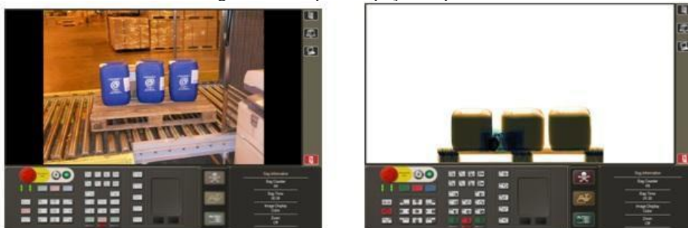
Figura 5: TBC para inspeção de paletes