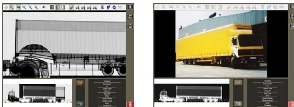
Figura 4: TBC para inspeção de veículos

Uma imagem fotográfica de cada bagagem e dos objetos nela contidos é disponibilizada, assim o treinando pode comparar a imagem obtida pelos raios X com a imagem fotográfica dos objetos que foram escaneados. O treinando é avaliado pelas decisões que toma analisando as imagens propostas pelo simulador e cada decisão é registrada gerando relatórios e análises. Na Figura 4 é apresentada uma tela do sistema, onde é mostrado um veículo visto pelos Raios X e a fotografia do equipamento real.