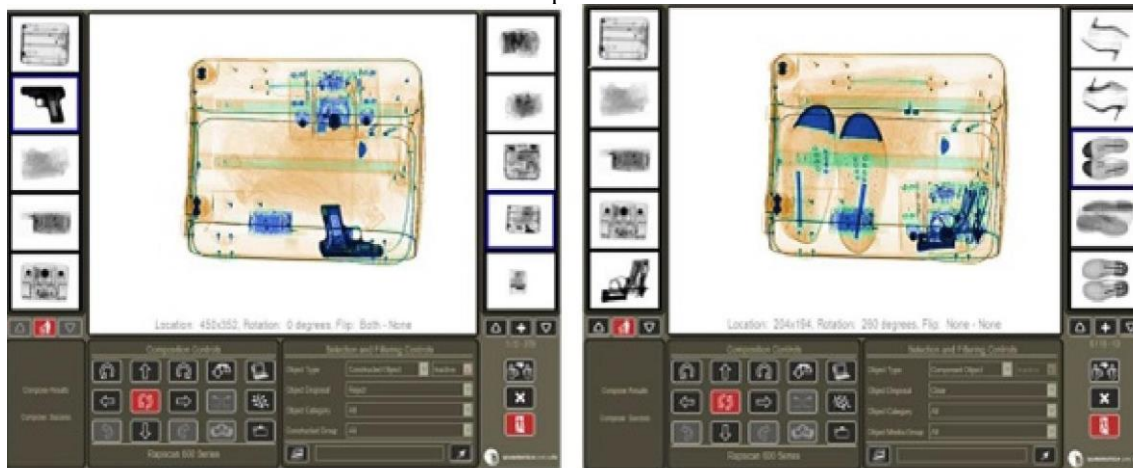
Figura 6: Imagem da mesma bagagem com diferente disposição dos objetos e adição de um par de sapatos

O X-SCREEN é capaz de combinar além de 400 diferentes malas, bagagens, mochilas e contendo 3000 objetos dos quais são 700 ameaças, podendo ainda ser criados milhões de diferentes composições para atender as mais diferentes e específicas necessidades de treinamento. O X-SCREEN permite a criação automática de uma biblioteca de bagagens combinando os vários objetos disponíveis de acordo com critérios definidos pelos instrutores de forma a atender as necessidades específicas de cada treinando e/ou cada treinamento. Após a criação automática das bagagens, critérios de avaliação podem ser editados considerando o os objetivos de cada treinamento.