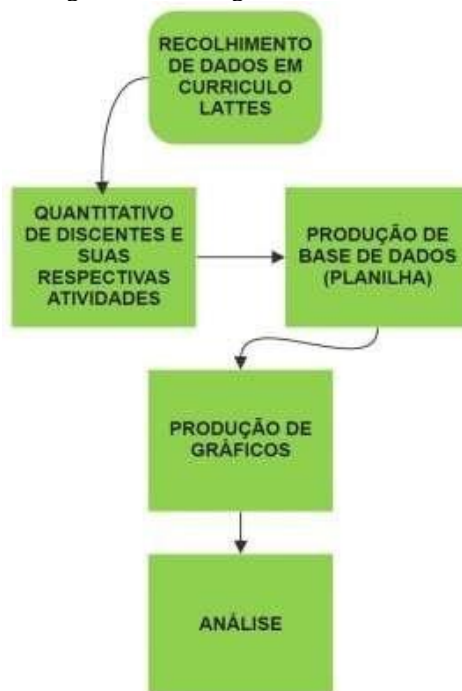
Figura 01 - Fluxograma de atividades