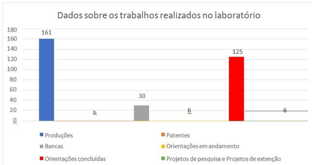
Figura 3: Trabalhos realizados no laboratório