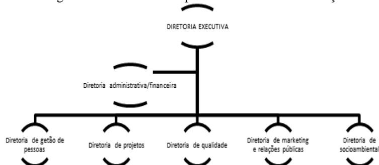
Figura 3: Estrutura da Empresa Júnior de Administração

A estrutura organizacional trata da forma com que as pessoas da entidade trabalham para alcançar os resultados da mesma. Além da diretoria executiva, a Empresa