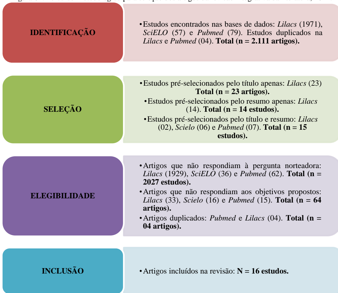
Figura 01. Percurso Metodológico para seleção dos artigos da revisão integrativa da literatura, 2022.