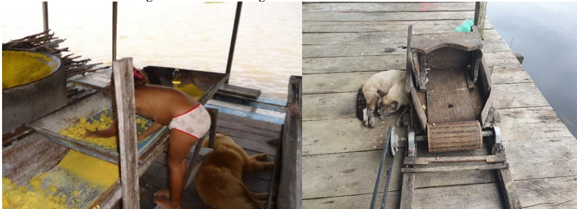
Figura 8 – Cachorro e gato na "casa de farinha flutuante"