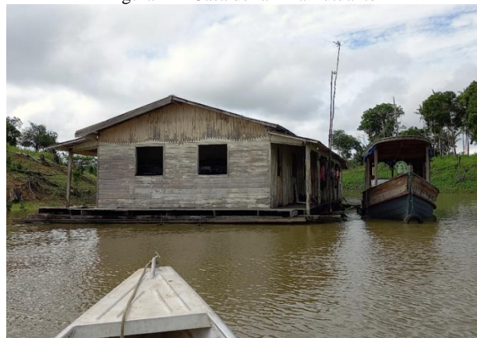
Figura 1 - "Casa de farinha flutuante"

A “Casa de farinha flutuante” em Janauacá trata-se de uma unidade de produção que apresenta relações complexas desde a extração da mandioca até chegar no local de confecção da goma e/ou farinha (Figura 1). Essas relações estão enraizadas na produção familiar camponesa e no trabalho temporário, como se fossem a única forma de resistência e autonomia produtiva desse espaço de produção (ERAZO e SILVA, 2016).