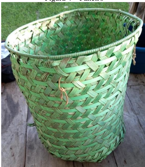
Figura 4 – Paneiro

Durante os períodos de secas, esse acesso somente é possível com longas caminhadas, o que exige grande esforço físico para o transporte da produção, feitas em artefatos de palha (paneiros) presos nas costas (MOURÃO, 2014) (Figura 4).