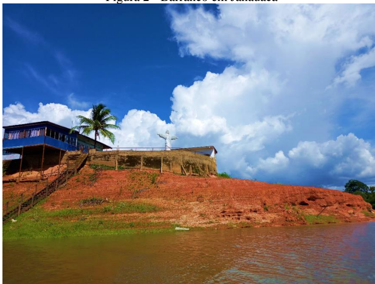
Figura 2 - Barranco em Janauacá

Segundo Mourão (2014), o fato dos moradores serem descendentes de retirantes nordestinos que adaptaram sua cultura a cultura amazonense, a facilidade do uso da água na produção agrícola e a mobilidade dos moradores, a partir da cheia de 1953, quando grande parte dos camponeses ribeirinhos perdeu seus roçados, tiveram suas casas de farinha alagadas, eles começaram a construir casas flutuantes e com as facilidades desta nova forma de habitação e a adaptação da casa de farinha/goma ter sido possível devido a facilidade da captação da água na produção de farinha, esta prática acabou sendo uma opção mais vantajosa.