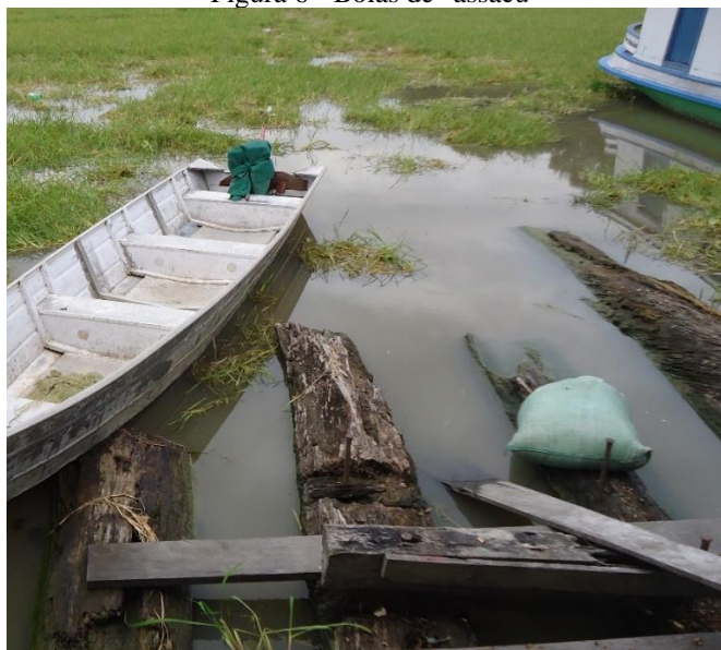
Figura 6 - Bóias de "assacu"

por causa da fiscalização ambiental. Uma bóia de Assacu dura cerca de 40 a 50 anos (Figura 6).