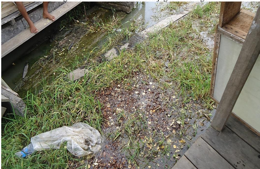
Figura 9 - Restos de mandioca jogados no lago