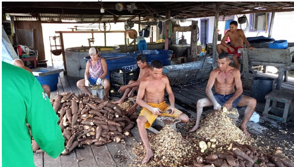
Figura 7 - Descascando a mandioca