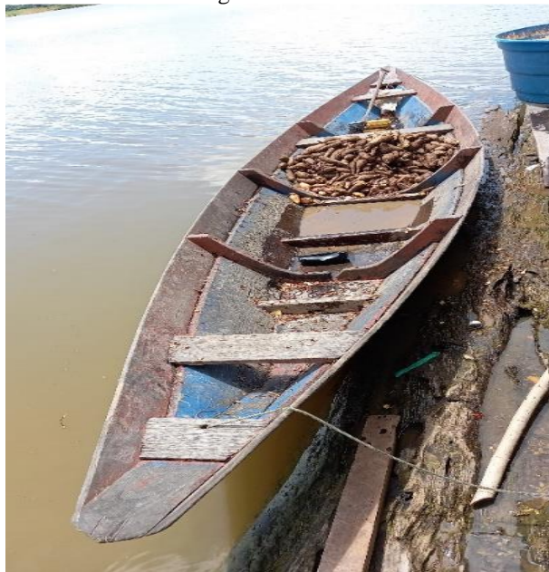
Figura 3 – Canoa

O acesso a essas terras agricultáveis torna-se mais fácil na época da cheia, devido a facilidade do transporte em canoas e “rabetas” (ERAZO, 2017) (Figura 3).