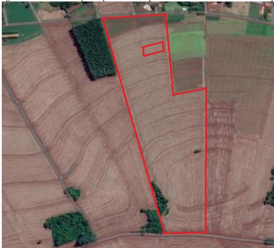
Figura 1 - Área de realização do plantio e acompanhamento do desenvolvimento da soja.