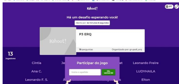
Figura 3 – Tela do Kahoot proposto pelo grupo B na terceira atividade