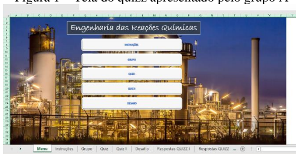
Figura 1 – Tela do quizz apresentado pelo grupo A