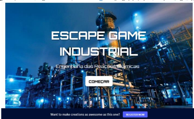
Figura 4 – Imagem da tela inicial do jogo proposto pelo grupo C