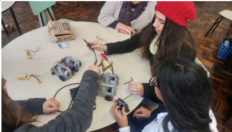
Figura 3 – Alunos manuseando os robôs didáticos durante o módulo de montagem.

O último módulo, contemplando a montagem do robô (Figura 3), foi realizado utilizando dois robôs didáticos projetados pelos acadêmicos participantes do projeto. Estes robôs foram desmontados e montados pelos alunos da EMEB durante as aulas com a supervisão dos instrutores.