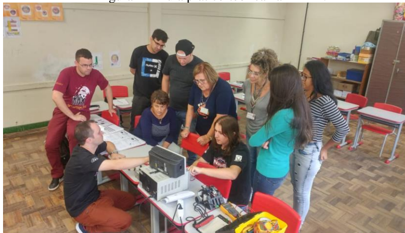
Figura 1 – Aula prático-teórica na EMEB.