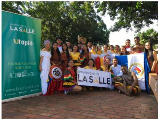
Figura 1. Apoyo en actividades de Bienestar Universitario.

Actividades: el comité se encarga de realizar y coordinar integraciones como la celebración del Día de la mujer, Día del hombre, Halloween, Día del Amor y la Amistad, entre otras. Así mismo, se interesan por desarrollar espacios de reflexión y de motivación con actividades de meditación y compartir de experiencias.