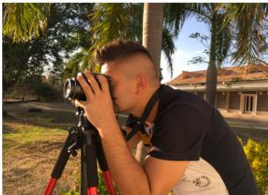
Figura 3. Estudiantes capacitándose en actividades propias del comité de comunicaciones.