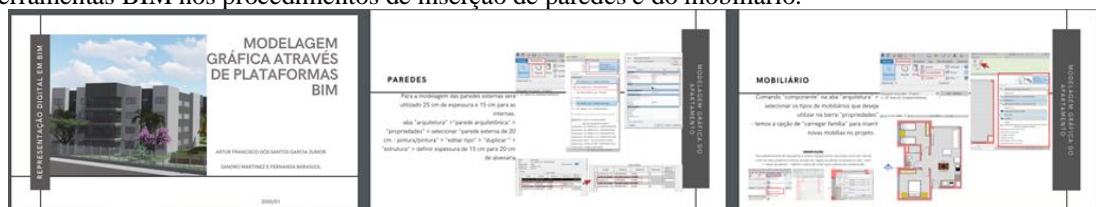
Figura 6. Capa do produto folheto desenvolvido e algumas das páginas mostrando a utilização das ferramentas BIM nos procedimentos de inserção de paredes e do mobiliário.

No final do componente, foi desenvolvido um livreto demonstrando em um “passo-a-passo” os procedimentos adotados na modelagem (Figura 6). O material gráfico foi postado no site ISSUU.