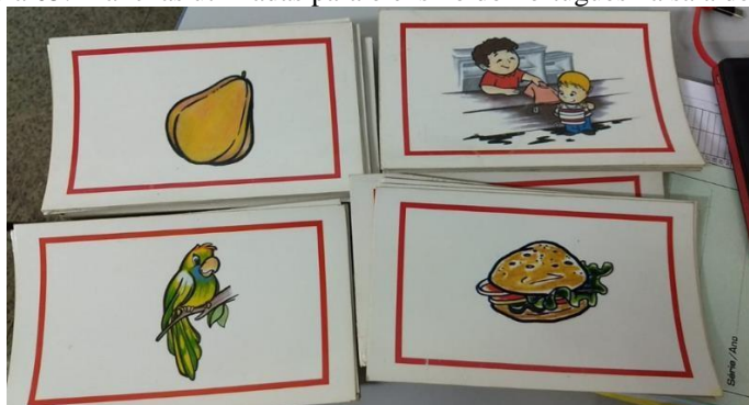
Figura 05: Pranchas utilizadas para o ensino do Português na sala de AEE

alunos Surdos em sua sala de aula, porém existem um “choque” de horário em relação a capacitação da turma de 5º ano. Outro ponto refere-se ao professor de Atendimento Educacional Especializado (AEE), que elabora um Plano individual para o aluno Surdo e usa vários recursos visuais no processo de ensino e aprendizagem desse educando. As Figuras 05 e 06 a seguir demonstram alguns recursos utilizados durante os atendimentos ao estudante Surdo na sala de AEE.