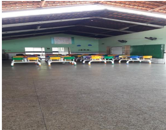
Figura 02: Refeitório da escola