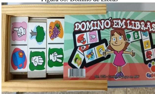
Figura 06: Dominó de Libras