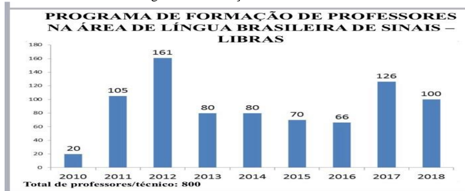
Figura 08: Formação de Professores