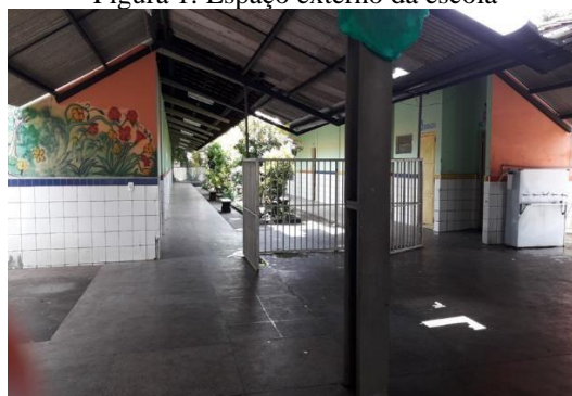
Figura 1: Espaço externo da escola

A escola situa-se na zona norte de Teresina (Piauí), com ampla estrutura física e organizacional acessível para os alunos com deficiência. Percebe-se o seguinte resultado: o Ideb 2017 nos anos iniciais alcançou 7,7, atingindo a meta estabelecida pela Secretaria de Educação especificamente para esta instituição. As figuras 01 e 02 a seguir demonstram a estrutura física da instituição: