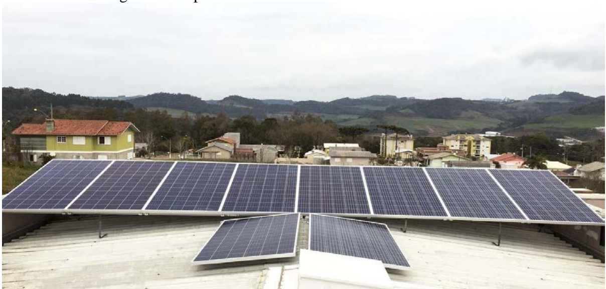
Figura 02: Suporte com módulos fotovoltaicos fixados

Eu tinha a opção de trocar de carro ou instalar o sistema de energia. Optei por instalar o sistema de energia solar pois ao meu ver me trará mais benefícios, entre eles o retorno do investimento em 4/5 anos, podendo assim trocar de carro. Além disso, não me privo mais do ar condicionado e ainda estamos contribuindo com o planeta utilizando uma energia limpa.