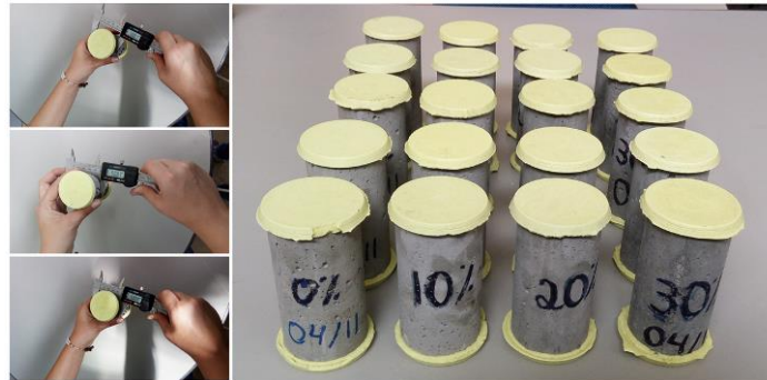
Figura 2 – Corpos de prova capeados

Como no Laboratório de Materiais da Construção Civil da UEMG-Passos não disponibiliza de uma máquina para esmerilhar os corpos de prova, procedeu-se o capeamento com enxofre (Figura 2).