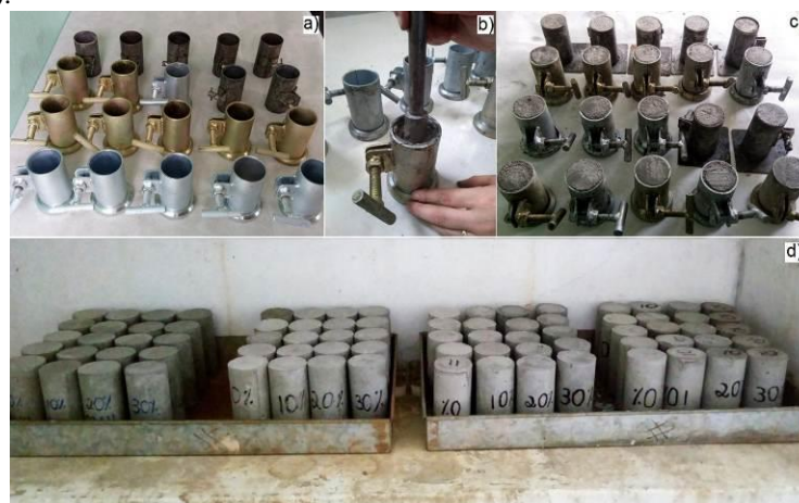
Figura 1 – Moldes utilizados (a); moldagem das argamassas (b); moldes com argamassa (c) e acondicionamento em câmara úmida (d).

Os corpos de prova foram desmoldados após 24 horas da moldagem e acondicionados em câmara úmida (Figura 1 (c)), protegidos de intempéries, em superfície horizontal rígida, livre de vibrações e de qualquer outra causa que possa perturbar a argamassa até a data de ensaio.