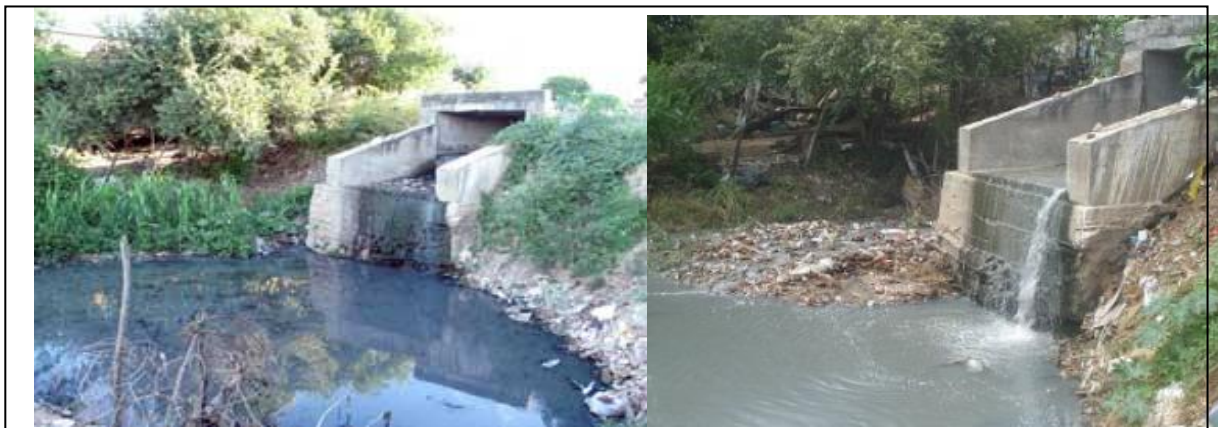
Figura 2 – Rio Jaguaribe recebendo esgotos no Município de Iguatu – CE.

Ainda é de costume, comunidades no mundo inteiro descarregarem esgotos, tratados ou não, em corpos de água superficiais, como solução para a eliminação de resíduos líquidos. Geralmente esses corpos de água servem como fonte de abastecimento a mais de uma comunidade, como é o caso do município de Iguatu – CE que descarrega esgotos domésticos, comerciais e de fossas, com gorduras, detergentes, fezes, urinas e restos de alimentos no leito do Rio Jaguaribe, como observa-se na Figura 2. Tudo isso escorre por canaletas ou por infiltração no subsolo e são despejados diretamente no leito do rio, na área urbana. Além de Iguatu, o Rio Jaguaribe recebe esgoto de dezenas de cidades, sem o adequado tratamento. Perenizado por águas de açudes na bacia do Alto Jaguaribe, há milhares de pessoas que vivem da produção agrícola e pecuária cuja fonte é o rio, daí a importância e a necessidade de construir sistemas de saneamento, tratamento e destino correto dos esgotos nos municípios.