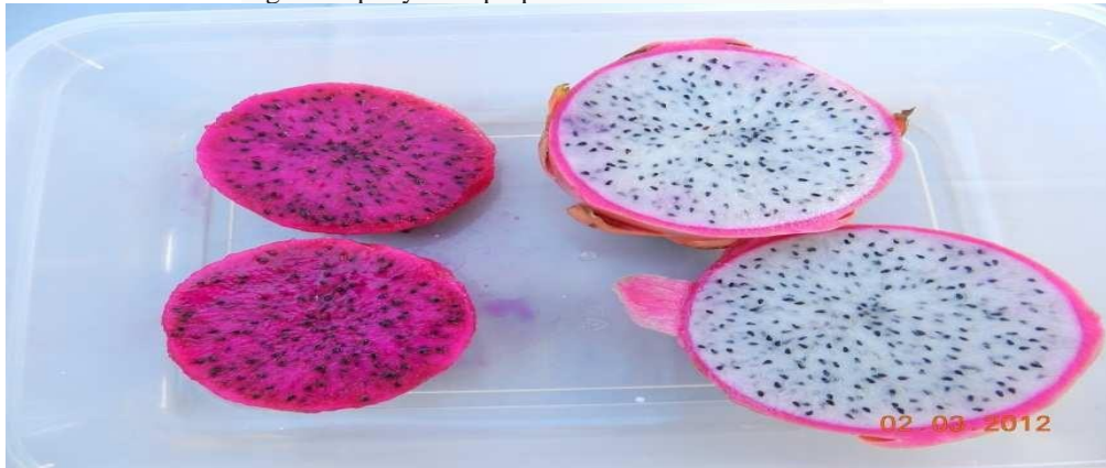
Figura 1- pitayas de polpa branca e vermelha in natura

Guaratiba – RJ. A atividade antioxidante foi determinada pelo ensaio TEAC seguindo o procedimento proposto por Re et al. (1999) usando o cátion radical ABTS •+ . A solução estoque de ABTS •+ (7 mM) foi preparada com K 2 S 2 O 8 como agente oxidante. A solução de trabalho de ABTS •+ foi obtida por diluição da solução estoque em etanol para dar uma absorção de 0,70 ± 0,02 em comprimento de onda igual a 734 nm. A extração dos antioxidantes foi realizada em triplicatas e em duas etapas, conforme segue: a primeira extração com metanol (50%) e a segunda com acetona (70%). Essa combinação é importante, pois os ciclos de extração com solventes com diferentes polaridades maximizam a extração de compostos antioxidantes com polaridades diferentes (Pérez-Jiménez et al., 2008).