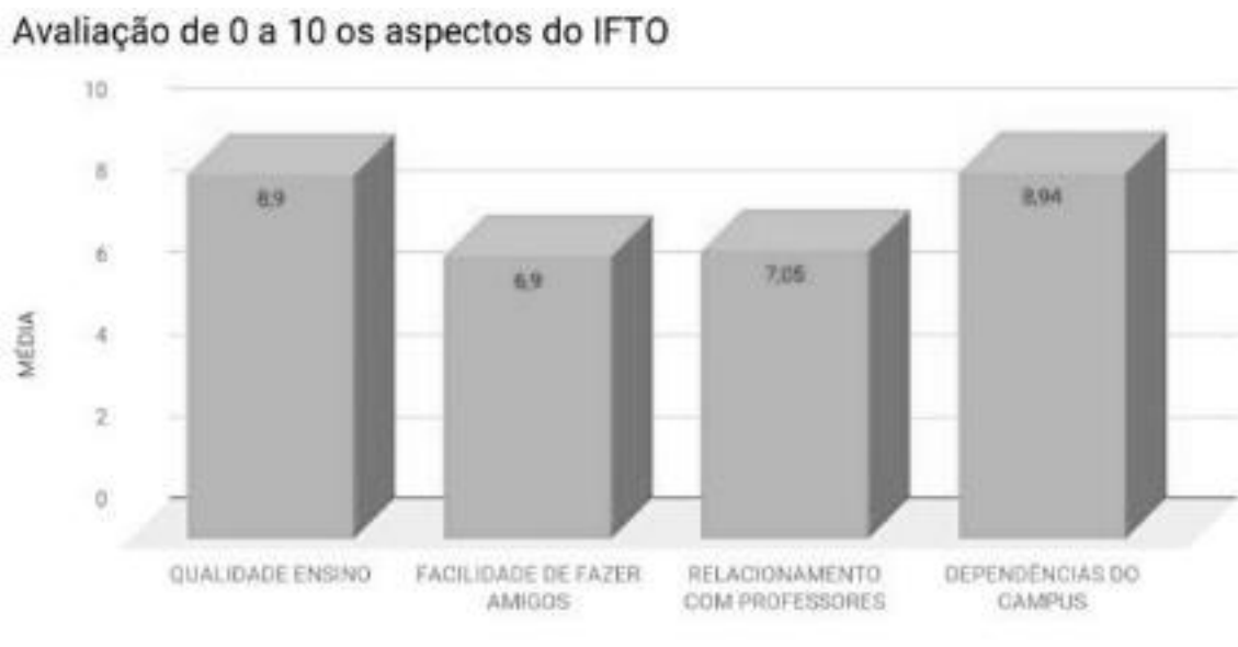
Figura 1 – Avaliação institucional feita pelos alunos

Fonte: questionários aplicados aos alunos