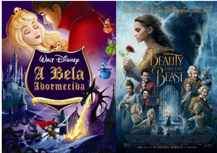
Figura 4. Imagem de Filmes em animação do Wall Disney. Imagem a) A bela Adormecida animação; Imagem b) A bela e a Bela um musical do conto