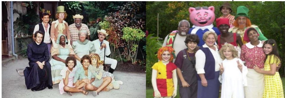
Figura 5. Elenco do Sítio do Pica-pau Amarelo do ano de 1977. Elenco do Sítio do Pica-pau Amarelo nos anos 2000.