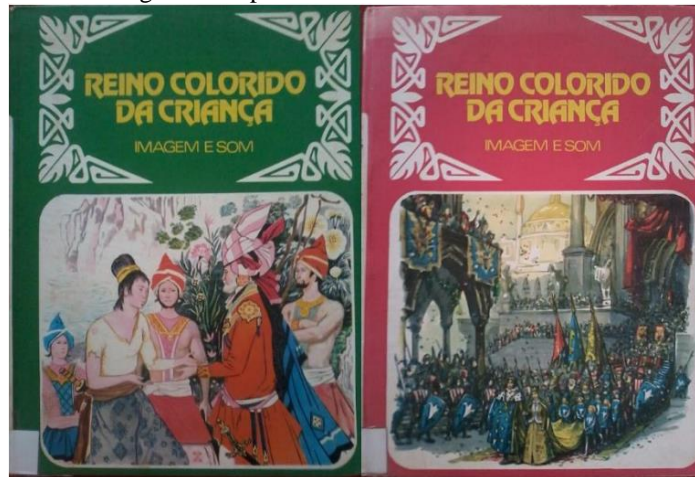
Figura 1. Capa dos livros volumes um e dois.

Os contos em sua maioria retratam um final feliz, mas as narrativas dos livros são cheias de detalhes do decorrer de todo um enredo, há um desenrola, uma mistura de outras figuras, o diálogo é pouco usado, tudo se passa por um narrativa-descritiva. O segundo volume é mais interessante ainda, além de reunir outros contos e lendas, traz muito mais contos e provérbios africanos, é bom saber que já desta época já se tinha um conhecimento sobre a riqueza que a cultura africana pode ter, assim os desenhos representantes da cultura africana como vestimentas e as características da cor e rosto, mas não deixam de ser bem interessantes, e claro é uma forma de fazer com se construa uma certa moral, além de explicar certos acontecimentos os quais uma criança pode se perguntar: por que o nosso cachorro dorme fora de casa, e nosso gato não? , essa pergunta é respondida por meio de uma história com um enredo bem comprido, mais que no final constróis muito mais que a resposta a essa pergunta.