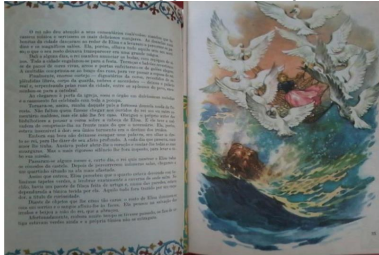
Figura 2. Imagem A) o texto é longo, detalhado, e passasse quase duas páginas sem ilustração. Imagem A) em outras a ilustração ocupa uma página inteira, ou dividido em duas páginas (Os cisnes Selvagens).

Por mais que os contos trazem finais felizes, a criança precisa ter em seu repertório de literaturas, textos que a ajude a entender, a se própria e ao outros, a literatura não falar somente de felicidades, assim como Bettelheim (2002) em a Psicologia dos contos de fada, o autor discute sobre o poder que essas leituras tem sobre a crianças no enfrentamentos de seus medos, Abramovich (2006), em sua obra Literatura Infantil: gostosuras e bobices, escreve docemente sobre como as literatura abordam tais assuntos como coragem, aventuras, amor, compaixão, mais também de como elas podem ir além de finais felizes, passando pelo do medo, pela perda, a dor, a morte, a descoberta da sexualidade, a separação, a literatura é a melhor forma que a criança encontra para entender o mundo que a cerca. Assim, como confirmar a Abramovich,