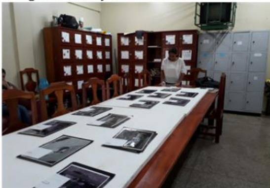
Imagem 4: estudantes organizando painéis