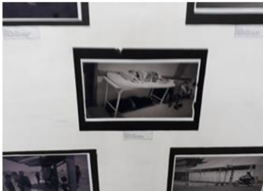
Imagem 1 e 2: algumas fotos