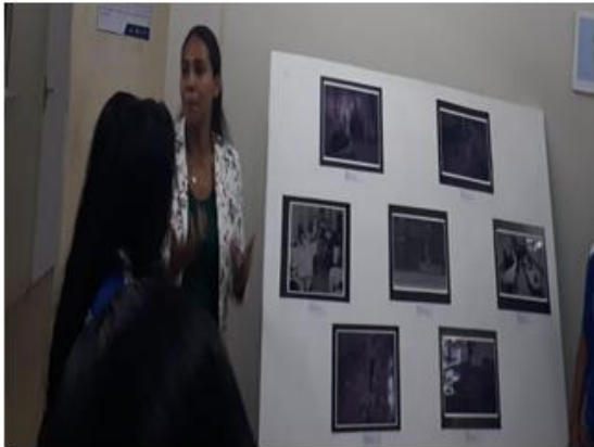
Imagem 5 e 6: Falando sobre os registros fotográficos