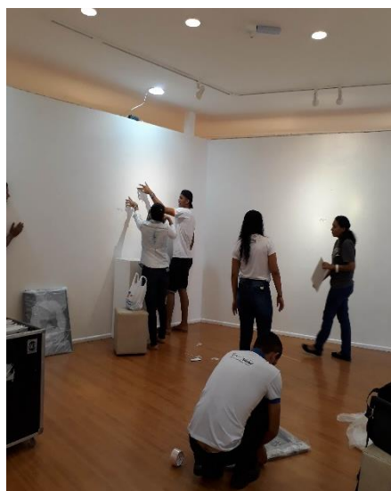
Imagem 10 e 11: Organizando a exposição

Os estudantes se mostraram bastante empolgados com a ideia de seus trabalhos serem expostos em uma galeria e de seus trabalhos estarem sob os olhares de diversas pessoas da comunidade, perceberam a importância em saber seus direitos, em construir e expor uma opinião de forma fundamentada de modo a se manifestar sobre as questões sociais.