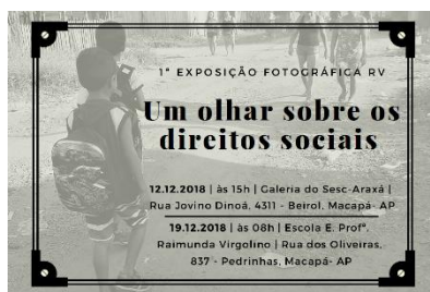
Imagem 9: Convite da Exposição

Os estudantes se mostraram bastante empolgados com a ideia de seus trabalhos serem expostos em uma galeria e de seus trabalhos estarem sob os olhares de diversas pessoas da comunidade, perceberam a importância em saber seus direitos, em construir e expor uma opinião de forma fundamentada de modo a se manifestar sobre as questões sociais.