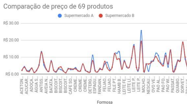
Figure 4: Comparação de preço de 69 produtos da lista de compras

O preço unitário de cada produto em cada supermercado está descrito no gráfico da Figura 4. Analisando a comparação direta de preços, não é possível perceber uma economia significativa devido a utilização individual dos valores, no entanto, ao analisar o conjunto - como o próprio conceito de lista de compras propõe - percebemos que há uma economia significativa para cada compra realizada, como está descrito no gráfico da Figura 5. Em determinado supermercado A, o valor total da lista de compras é de R$ 398,44 e no supermercado B o valor total é de R$ 376,63. É notável que há uma economia de R$ 21,81 (5,47%) ao comprar os produtos exclusivamente no supermercado B.