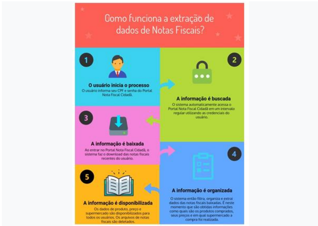
Figure 1: Infográfico demonstrando o funcionamento do Superpagg