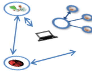
Figura 2. Educación virtual

En la educación tradicional, el profesor es quien transmite conocimientos al alumnado que de forma pasiva comprende, transforma y construye sus conocimientos con base en lo que el profesor le enseña, mientras que en la educación virtual tiene como protagonista al estudiante; entonces el profesor se convierte en un asesor o un instructor para los alumnos y los orienta para que ellos se desarrollen de manera autodidacta y que tengan iniciativa y creatividad para su aprendizaje (Marcelo, 2002).