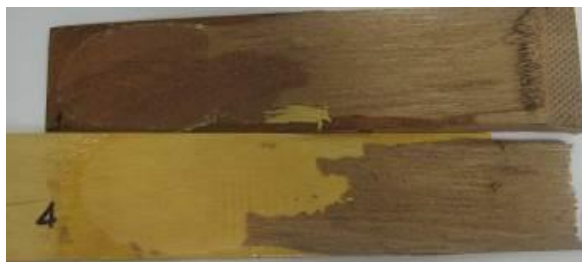
Figura 2. Modo de ruptura típico apresentado pelos corpos de prova de junta biselada, corpos de prova n° 1 e n° 4.

Através da Figura 2 podemos perceber que na região da superfície de colagem, houve ruptura de parte da superfície da madeira Freijó, juntamente com uma parte do adesivo, fato este que indica que houve uma aderência muito boa entre o adesivo e a madeira Freijó. Todos os corpos de prova de junta biselada obtiveram ruptura na madeira da região de colagem e em parte do adesivo.