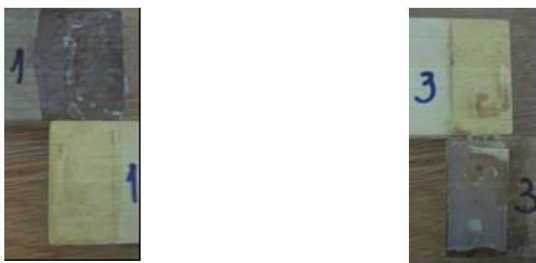
Figura 4. Modo de ruptura típico apresentado pelos corpos de prova de junta sobreposta, sendo o corpo de prova n° 1 (esquerda) e n° 3 (direita).

A Figura 4 mostra o corpo de prova n° 3, que foi o único que apresentou ruptura em uma pequena parte da madeira da região de colagem, fato este que pode ser creditado a uma falha da madeira nesta região. 85,7% dos corpos de prova de junta sobreposta obtiveram ruptura no adesivo.