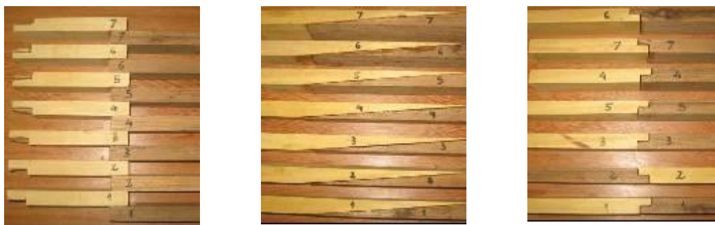
Figura 1. Corpos de prova de junta sobreposta (esquerda), biselada (centro) e encaixada (direita), utilizados no ensaio de tração

Foram preparados 21 corpos de prova, sendo que a quantidade, tipo de junta e suas respectivas dimensões são mostradas na Tabela 1.