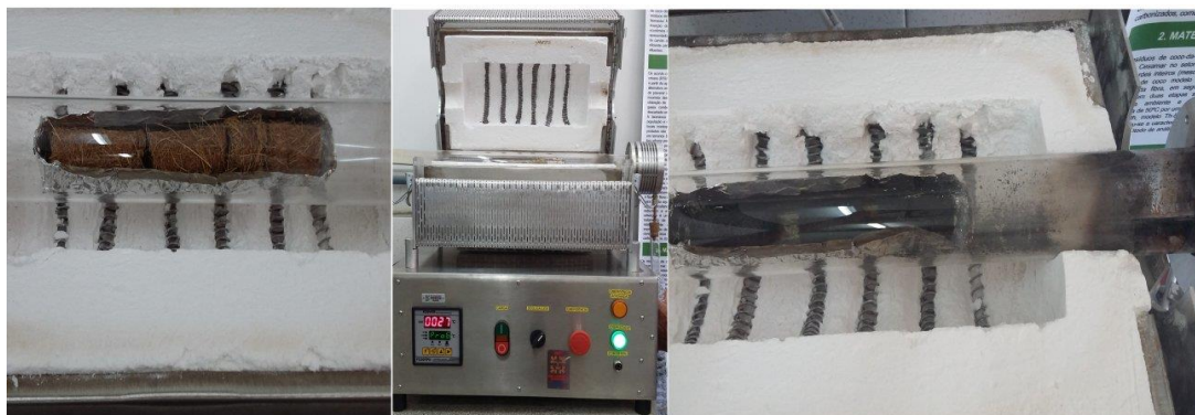
Figura 3: Processo de pirólise do briquete da fibra de Coccoloba nucifera L.