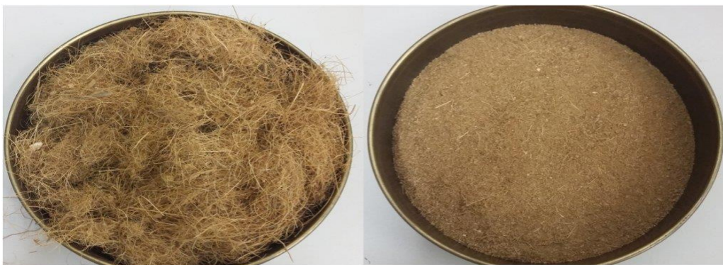
Figura 1: (a) fibra do Coco da baía triturada (b) biomassa após moagem.

A produção da biomassa deu-se a partir da trituração e moagem do fruto verde in natura sem a água, composto de epiderme, mesocarpo fibroso, endocarpo e albumen em triturador modelo TRC-40 5V mono TRAPP e em seguida seco a sombra em temperatura ambiente Figura 1.