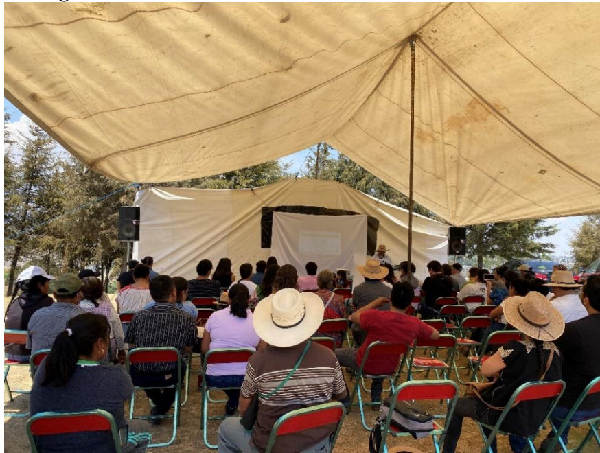
Figura 1. Asamblea de Cholultecas Unidxs en Resistencia