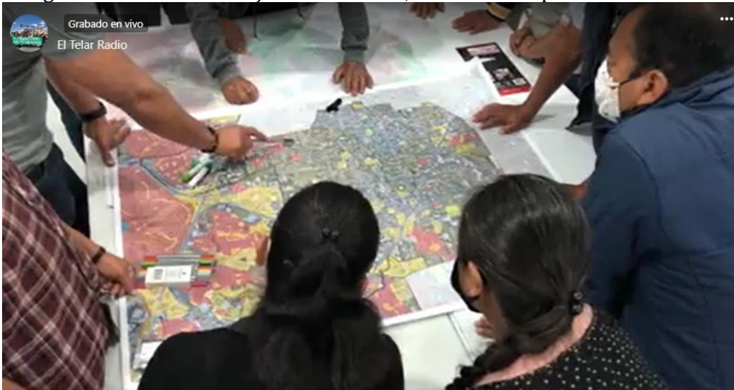
Fotografía de El telar radio. 2022

San Andrés Cholula es una comunidad que lucha por mantener la diversidad étnica de su territorio y se esfuerza por protegerlo frente a la gentrificación y puede encontrarse de repente con que los impuestos prediales de sus tierras aumentan, a medida que los agentes inmobiliarios ofrecen la imagen de seguridad y contacto con la naturaleza a nuevos habitantes.