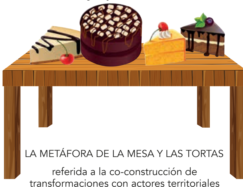
Figura 1 Metáfora de la inteligencia territorial y la justicia territorial latinoamericana

sistematizó en ocho fases (Bozzano, 2013a, 2013b) y en 2020 en nueve: territorios reales, vividos, pasados, legales, pensados, posibles, concertados, inteligentes y justos (Bozzano et al., 2020a). Se ejecuta con diez a veinte técnicas sociales y espaciales, particularmente mapas temáticos, MTP, entrevistas, encuestas, historias orales, fotointerpretación, teledetección satelital y estadística. Se trata de un método cuyo objetivo es acompañar procesos de IAP particularmente transformadores, en territorios y lugares donde se piensan y sentipiensan identidades, necesidades y sueños, vale decir, posibles problemas y sus soluciones, entre las cuatro patas de la mesa de la IT y la JT latinoamericanas: tres con base en los pilares de la regulación propuestos por Max Weber (Estado, mercado y comunidad) y la restante, denominada la pata cognitiva , con base en la educación popular de Paulo Freire y el paradigma científico emergente en de Sousa Santos.