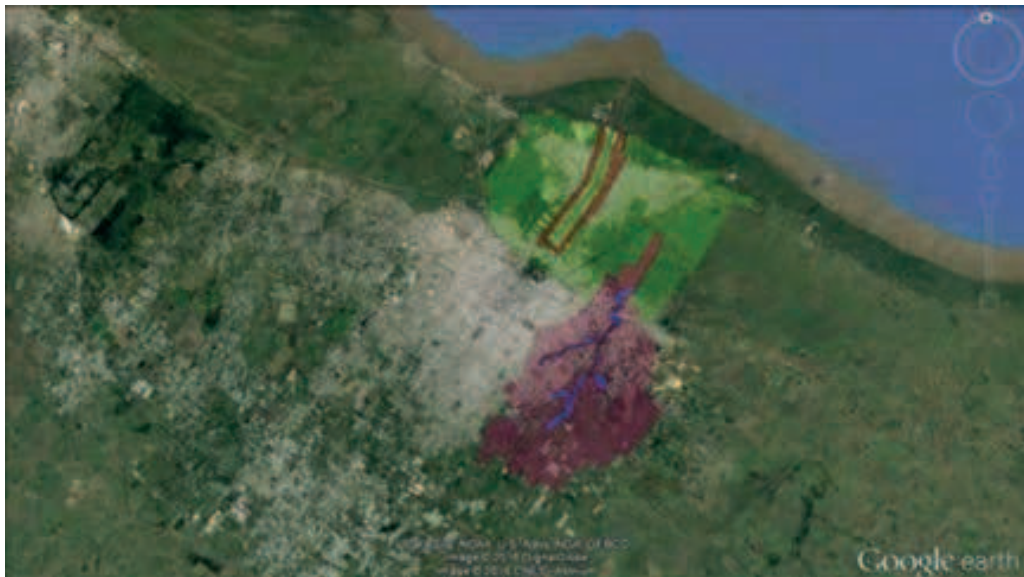
Figura 2 Espacios geográficos objeto de investigación en las ACP: municipios de La Plata, Ensenada y Berisso (Buenos Aires, Argentina).