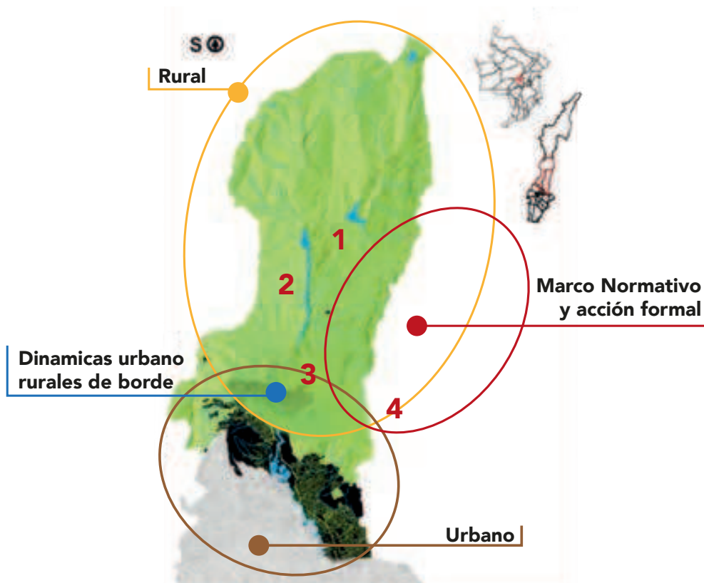
Figura 4 Corema

Por último, el cuarto grupo se ocupó de las dinámicas formales representadas por la acción institucional, las políticas y las normas que ordenan y regulan este territorio y el agua. Esta dimensión, más que una aproximación territorial, como las tres anteriores, se concibió como una dimensión transversal que miraba cómo desde las disposiciones internacionales, pasando por las nacionales, las regionales, hasta las más locales, se produce un impacto en el agua y el territorio en el contexto que observamos y su área de estudio.