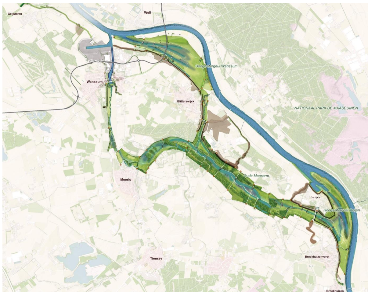
Figuur 2: Plankaart van de gebiedsontwikkeling Ooijen-Wanssum