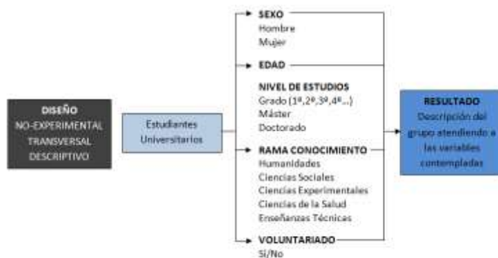
Figura 1. Modelo de diseño observacional descriptivo.

Esta propuesta de investigación presentará distintos diseños de investigación, g. Esta investigación se realizará utilizando un sistema mixto tanto a nivel metodológico como en las fases operativos de trabajo que se vayan a desarrollar. Por un lado, existirá un diseño de estudio no experimental cuantitativo y otro cualitativo tanto transversal (curso académico) como longitudinal (año de etapa académica) mediante un diseño híbrido de cohortes (estudiantes universitarios) y estudios de caso-control diferenciando los grupos marcados en la muestra (Figura 1).