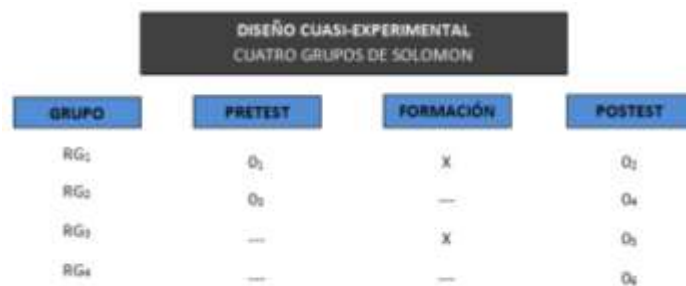
Figura 2. Diseño experimental 4 grupos de Solomon.