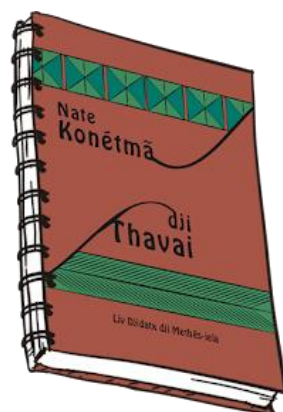
Imagem 3. Livro didático Galibi-Marworno “Nate Konétmã dji Thavai: jidatk dji Methés-íela”. Fonte: Silva et al. (2019).

Como produtos do trabalho do projeto de Valorização das línguas Crioulas do Norte do Amapá há materiais paradidáticos publicados em 2019 que contemplam as duas ortografias recentemente atualizadas, representativas para os Karipuna e Galibi-Marworno. Entre os produtos há livros paradidáticos com narrativas tradicionais e dois manuais simplificados de escrita. Apresentamos abaixo a arte utilizada para os livros Karipuna e Galibi-Marworno: