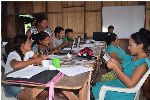
Imagem 2. Professores, participantes da oficina, trabalham nos exercícios e textos do livro didático Galibi-Marworno na aldeia Kumarumã.

Como produtos do trabalho do projeto de Valorização das línguas Crioulas do Norte do Amapá há materiais paradidáticos publicados em 2019 que contemplam as duas ortografias recentemente atualizadas, representativas para os Karipuna e Galibi-Marworno. Entre os produtos há livros paradidáticos com narrativas tradicionais e dois manuais simplificados de escrita. Apresentamos abaixo a arte utilizada para os livros Karipuna e Galibi-Marworno: