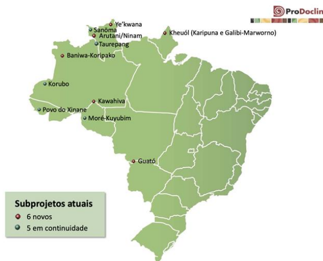
Mapa 1. 3ª fase do Projeto Salvaguarda do Patrimônio Linguístico Cultural de Povos Indígenas Transfronteiriços e de Recente Contato na Região Amazônica.

Como pode ser observado no Mapa 1, um dos subprojetos tem como locus o Estado do Amapá, especificadamente no município de Oiapoque, contemplando a língua kheuól falada pelos povos Karipuna e Galibi-Marworno na Terra Indígena Uaçá.