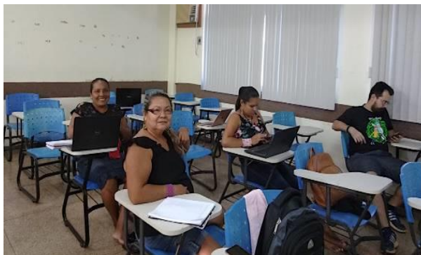
Imagem 6. Pesquisadores indígenas durante oficina sobre a BASE.

A BASE está em formato Fieldwork`s Language Explorer – FLEx, uma plataforma livre disponível na internet . Essa plataforma, além de organizadora de dados linguísticos, também formata e gera dicionários bilingues.