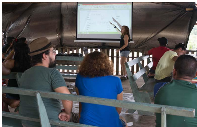
Imagem 1. Discussão sobre a organização do material didático Karipuna em reunião na aldeia Santa Isabel.