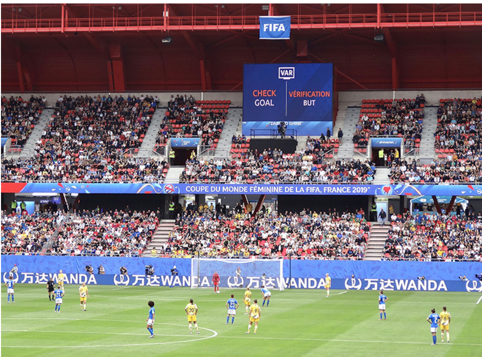
Kuva 3. Maalin hyväksymisen VAR-tarkastuksesta kertova näyttö stadionilla naisten jalkapallon MM-kisoissa vuonna 2019.