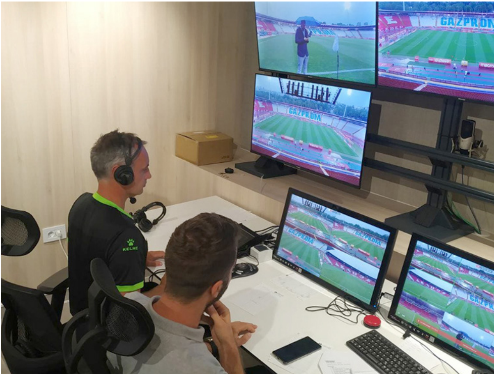
Kuva 2. VAR-tuomari työssä Serbian Superliigan ottelussa vuonna 2021.