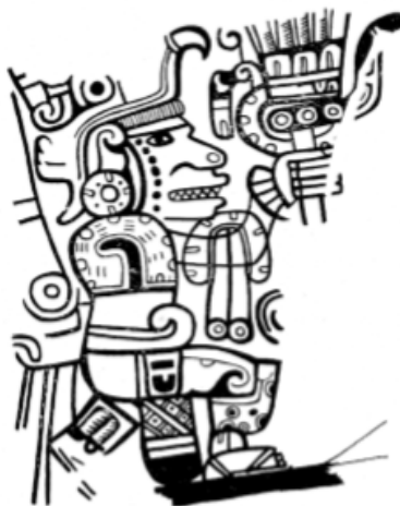
Figura 3 Personaje plasmado en el altar policromado, que refleja mutilación dental, así como un elaborado atavío

Du Solier (1947) y Zaragoza (2003) son quienes se dedican al análisis de los motivos decorativos representados en los frisos. Du Solier (1947) infiere sobre una organización social compleja, por la asociación de arquitectura y pintura a entierros, así como las representaciones gráficas que se pueden relacionar la simbología con prácticas culturales arraigadas por el grupo como es la mutilación dental, la expansión de los lóbulos y perforación del septum. Dejando ver también en las ilustraciones la indumentaria que usaban para ataviarse como telas, pieles y plumas, además de adornos en la piel (Figura 4).