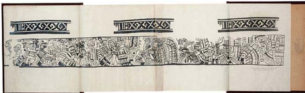
Figura 2: Parte del mural descrita por Du Solier donde se muestran guerreros y dioses en procesión