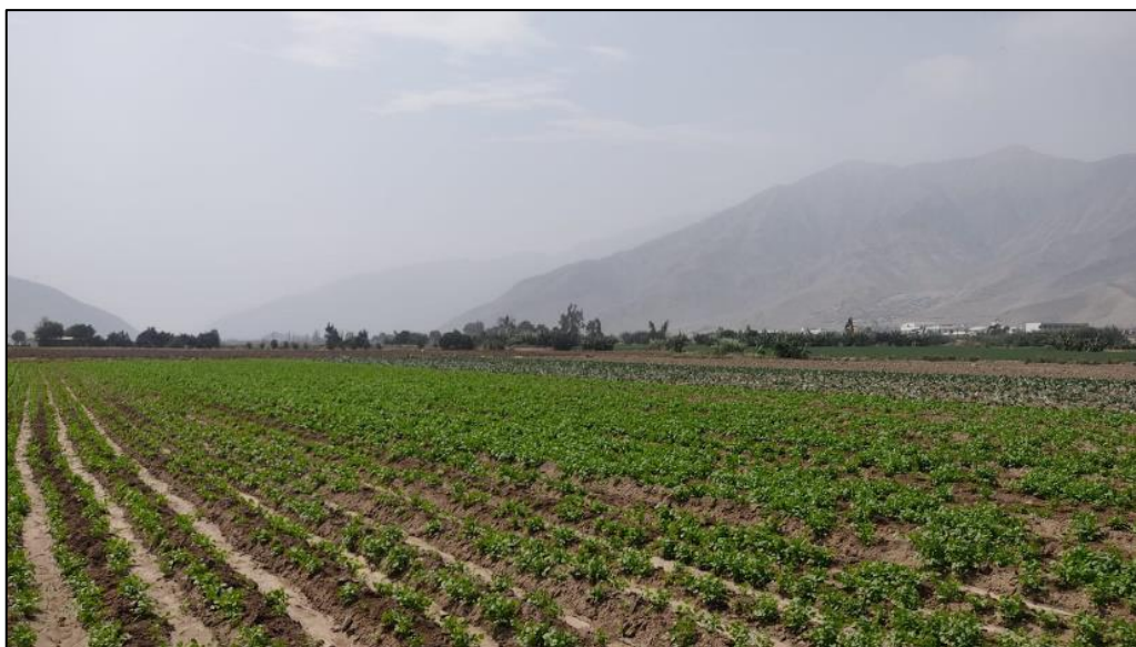
Figura 9: Terreno agrícola con culantro

Nota: La diversidad de cultivos establecidos por el agricultor constituye una fortaleza para pagos futuros.