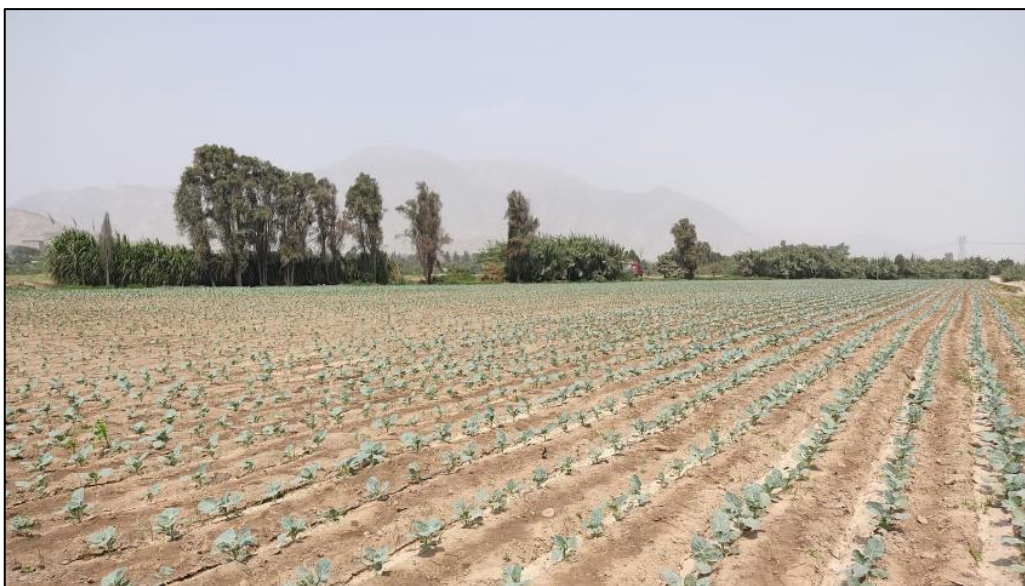
Figura 7: Terreno agrícola sembrado con brócoli

Nota: La buena calidad de los plantines llevados a campo definitivo es esencial para obtener futuras cosechas con altos rendimientos.