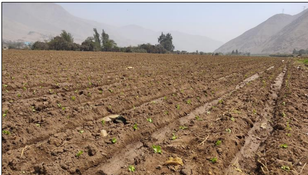
Figura 3: Terreno agrícola sembrado con lechuga

riego, fumigación y fertilización, y vehículos de transporte de carga y mercancía. Estos activos son parte fundamental de la capacidad productiva del agricultor y son verificados para obtener un panorama más amplio del agricultor.