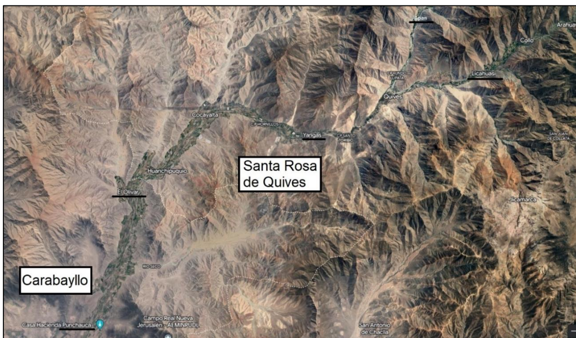
Figura 1: Valle del Chillón (Carabaylo, Santa Rosa de Quives)

El valle del Chillón se encuentra en la costa central del Perú (Figura 1), entre las coordenadas geográficas de latitud sur entre 11^{\circ}18' y 11^{\circ}58' y de longitud oeste 76^{\circ}23' y 77^{\circ}09' ; hidrográficamente se encuentra ubicada en la vertiente del pacífico, siendo sus límites por el norte con las cuencas de Chancay-Huaral, por el sur con el valle del Rímac, por el este con el valle del Mantaro y por el oeste con el Océano Pacífico; como vías de comunicación importantes tenemos la carretera Puente Piedra – IPEN (Instituto Peruano de Energía Nuclear) y la carretera Lima – Canta, ambas asfaltadas.