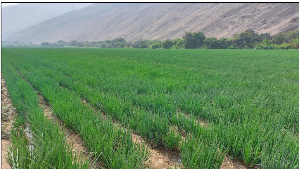
Figura 10: Terreno agrícola con cebolla china

Nota: La diversidad de cultivos establecidos por el agricultor constituye una fortaleza para pagos futuros.