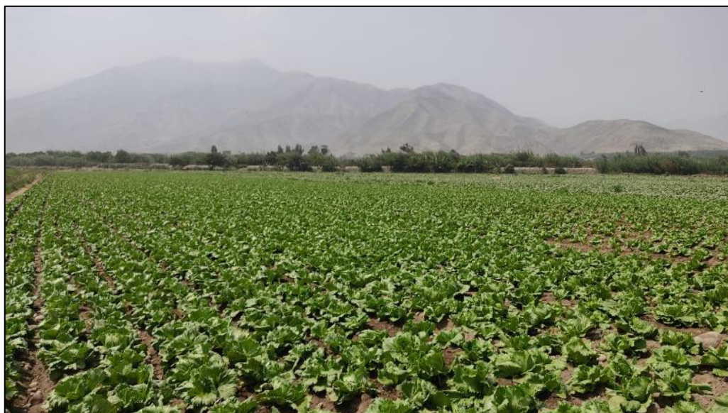
Figura 4: Campo de cultivo con Lechuga Americana

Nota: La constatación de actividades productivas es esencial ya que muestra la experiencia del agricultor.