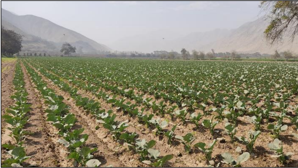
Figura 5: Campo de cultivo con Brócoli

Nota: La buena cobertura del terreno y la sanidad del cultivo garantizan en buena medida la pericia del agricultor solicitante del préstamo.