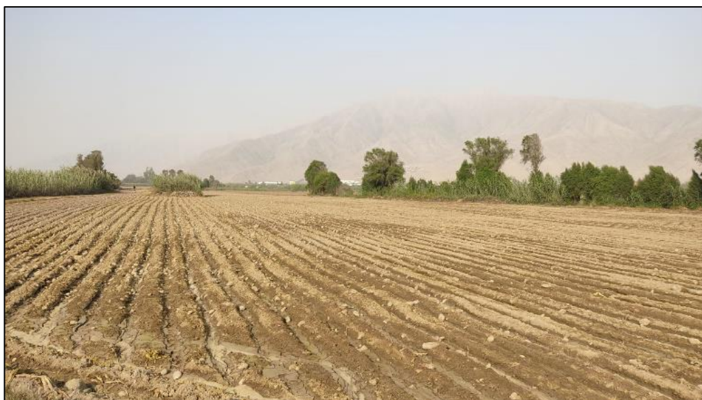
Figura 8: Campo de cultivo con brócoli

Nota: La buena calidad de los plantines llevados a campo definitivo es esencial para obtener futuras cosechas con altos rendimientos.