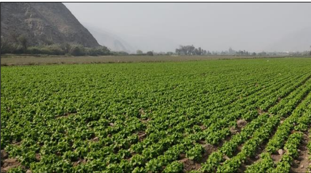
Figura 6: Campo de cultivo sembrado con perejil

Nota: La buena cobertura del terreno y la sanidad del cultivo garantizan en buena medida la pericia del agricultor solicitante del préstamo.