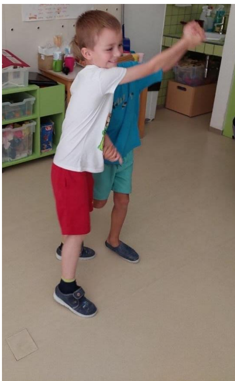
Slika 5: Dečka vadita drugi gibalni motiv.