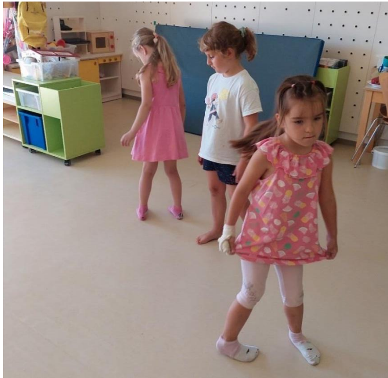
Slika 15: Deklice plešejo prve motive malgaškega plesa.