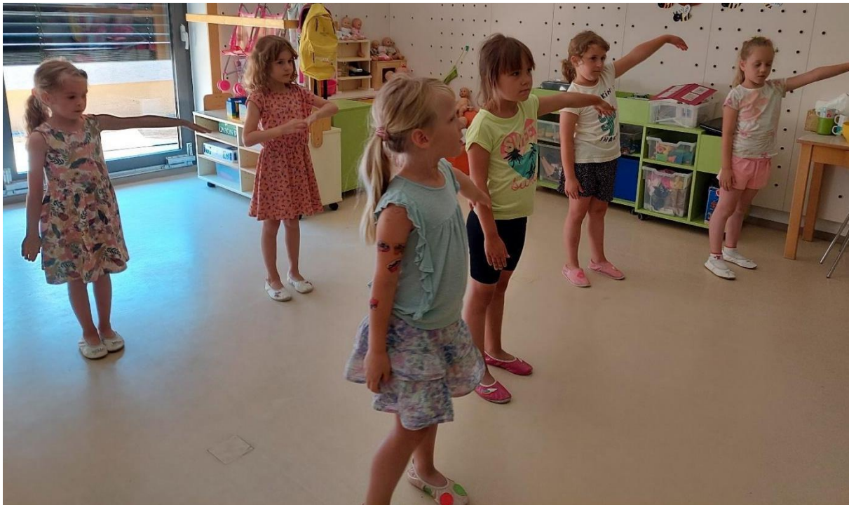
Slika 25: Utrjevanje tretjega gibalnega motiva.