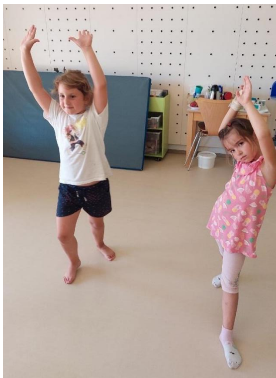
Slika 18: Izredno izvajanje gibalnih motivov.