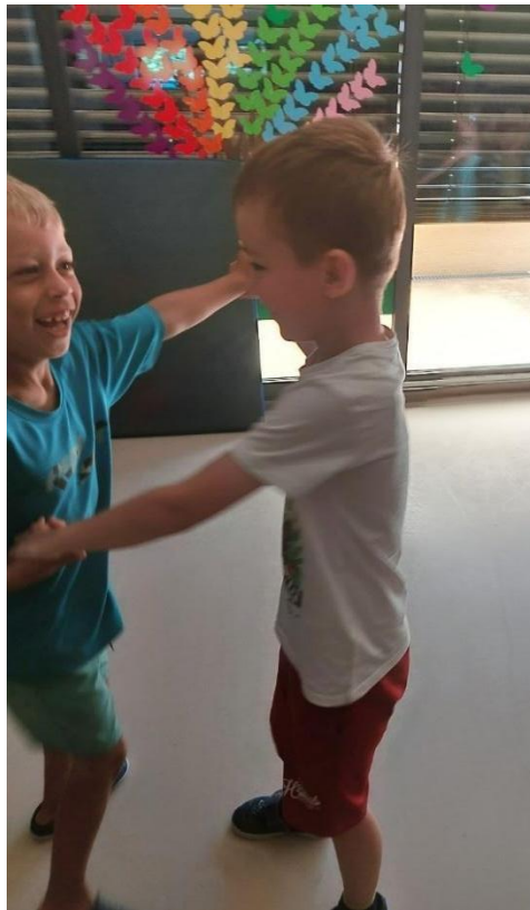
Slika 7: Veselje dečkov ob plesnem nastopu.