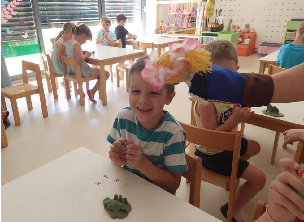
Slika 9: Deček izraža veselje, ko ga lutka poboža.