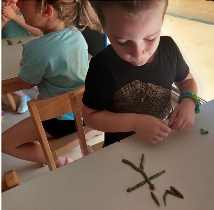
Slika 11: Deček iz mase izdeluje plesalca.