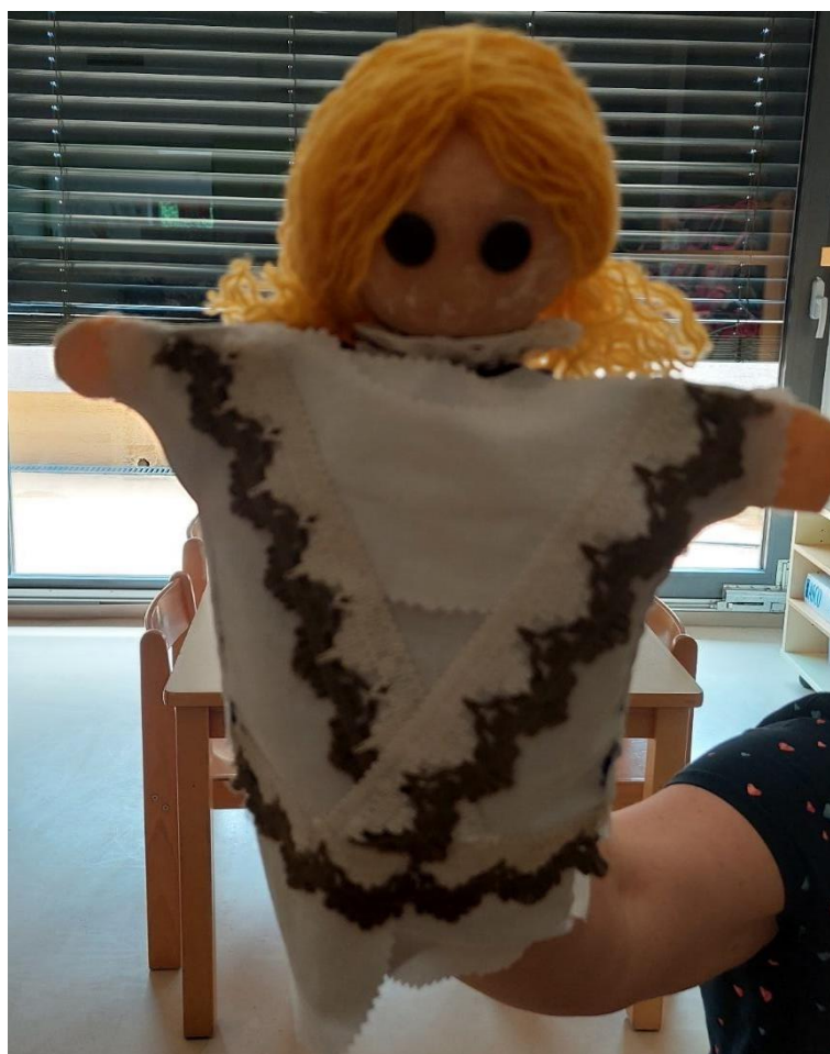
Slika 22: Lutka oblečena v kitajsko narodno nošo.