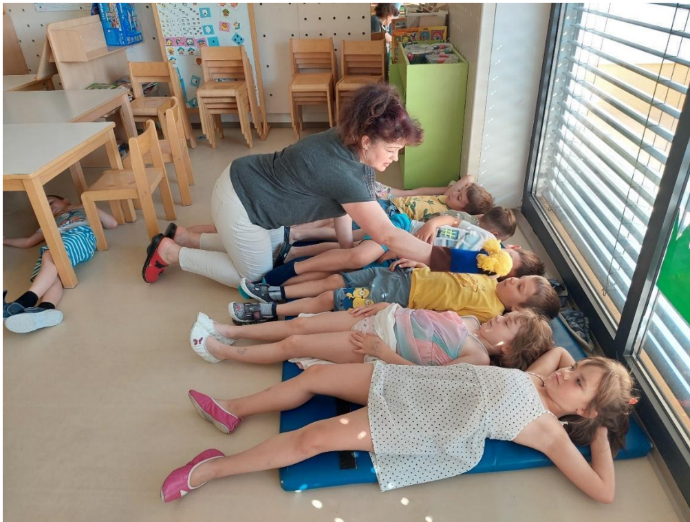
Slika 3: Otroci čakajo, da jih lutka poboža.