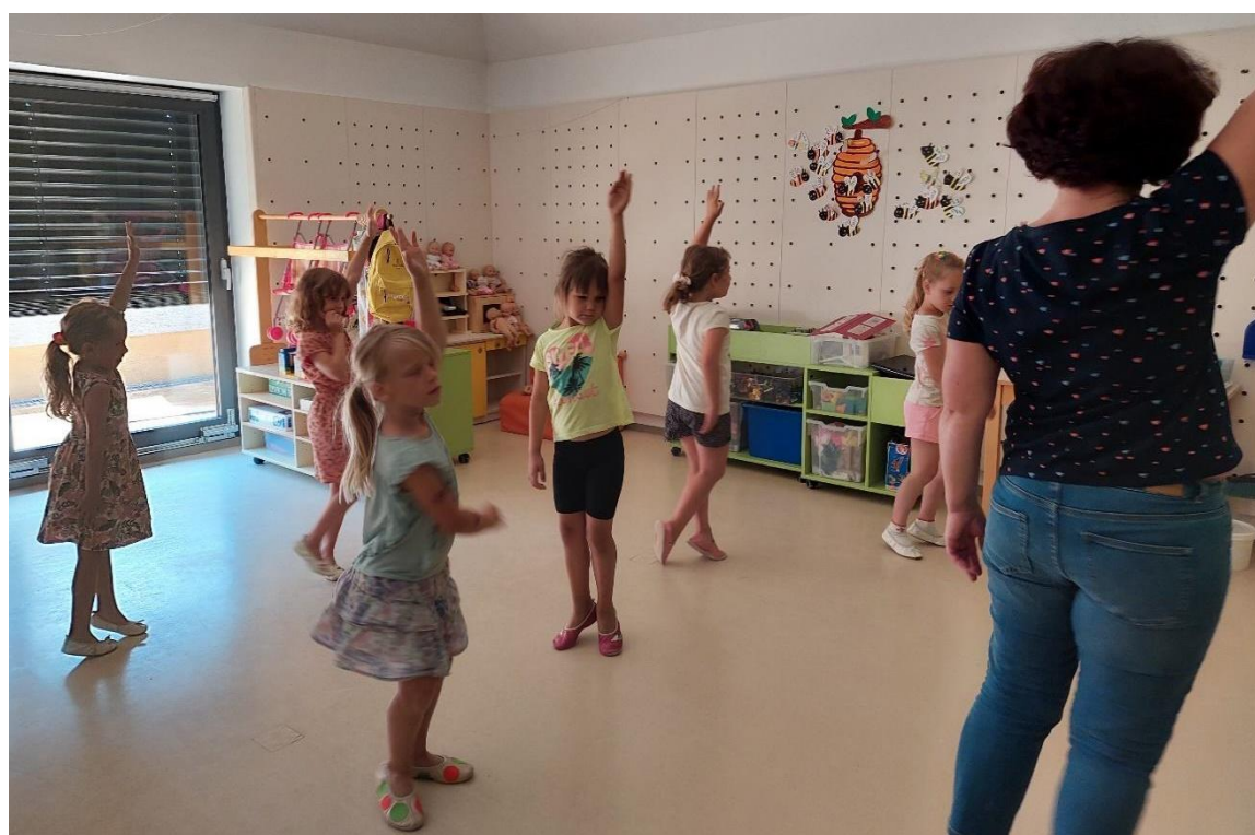
Slika 24: Deklice za mano ponavljajo drugi gibalni motiv.