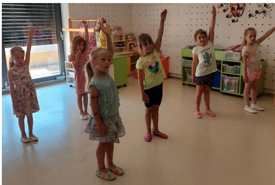
Slika 23: Deklice za mano ponavljajo prvi gibalni motiv.