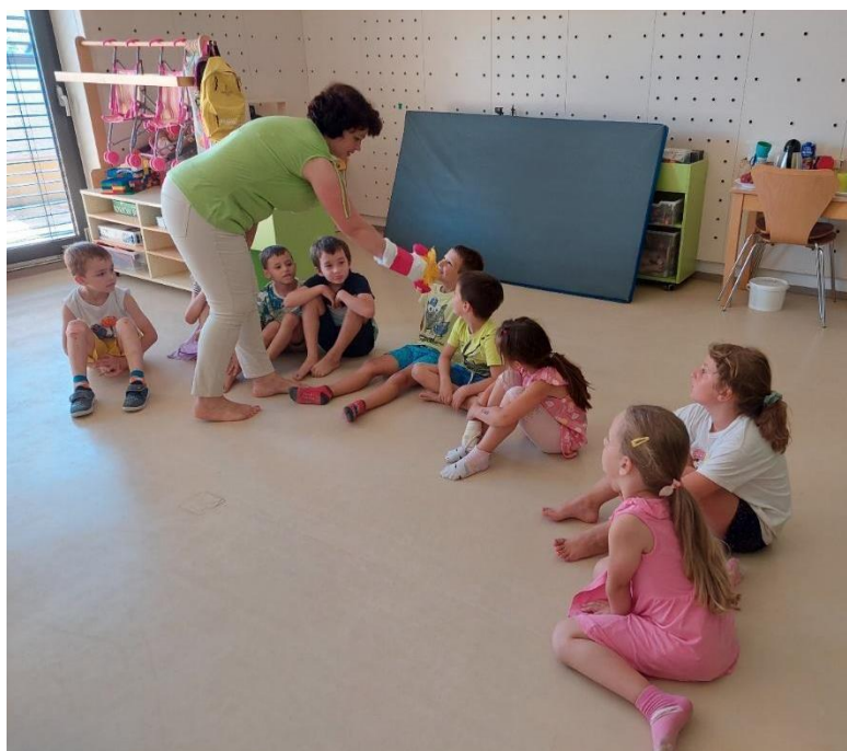
Slika 19: Lutkina zahvala otrokom za sodelovanje in njeno povabilo v likovni kotiček.