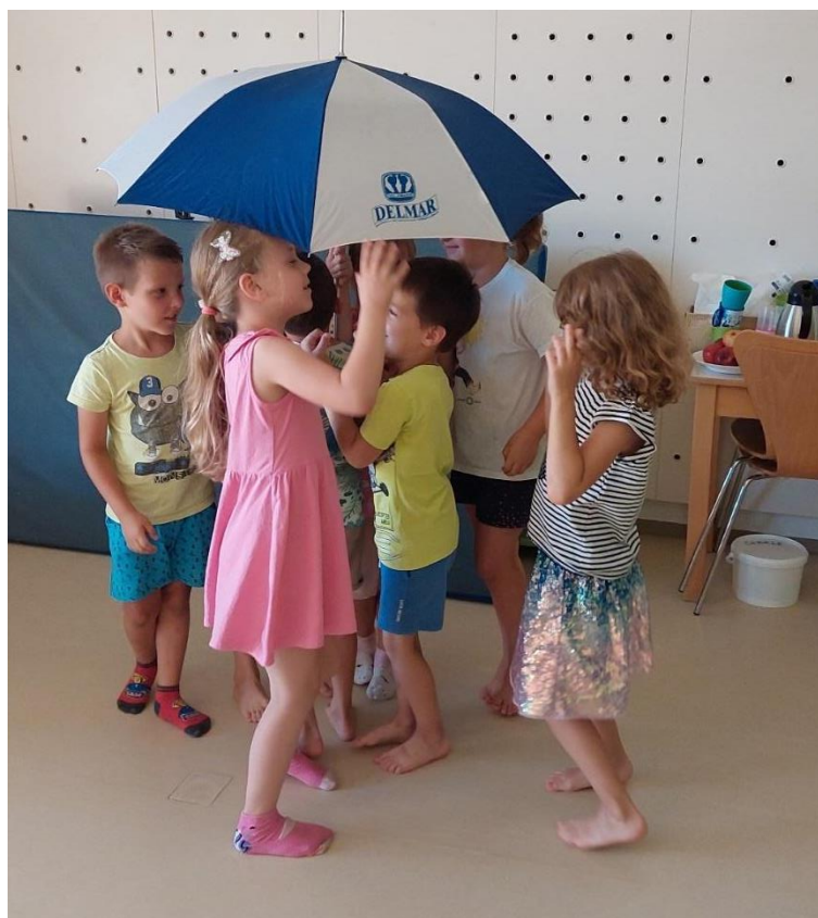
Slika 16: Otroci s pomočjo dežnika uprizarjajo gibalne motive malgaškega plesa.