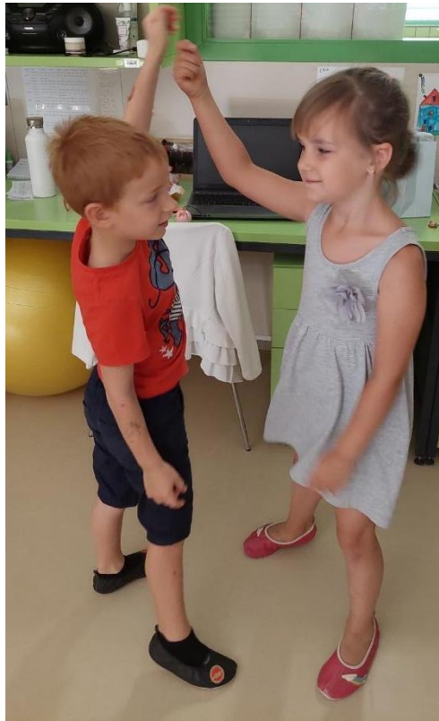
Slika 4: Deklica in deček vadita prvi gibalni motiv.

jim Ronja približa, še bolj pa takrat, ko jih poboža. Pripravili smo maso, iz katere so oblikovali plesalce, gradove, oziroma karkoli, kar je bilo smiselno v plesni dejavnosti. Prav na koncu pa so si zaslužili piškote, ki smo jih spekli doma. Zadovoljni smo končali naš drugi delovni dan.