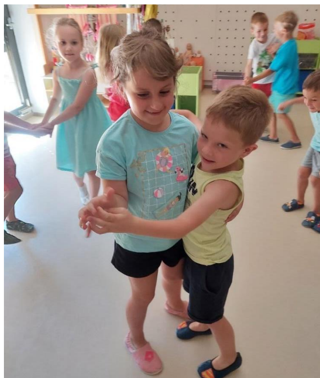
Slika 6: Otroci plešejo v parih.