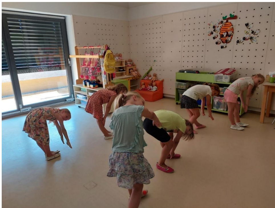
Slika 26: Deklice nadaljujejo s četrtim gibalnim motivom.