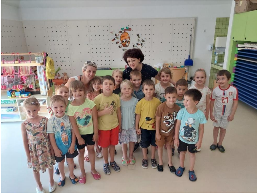
Slika 27: Naša spominska fotografija.