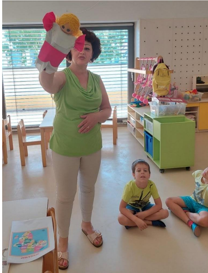
Slika 13: Lutka se predstavi v Malgaški narodni noši.