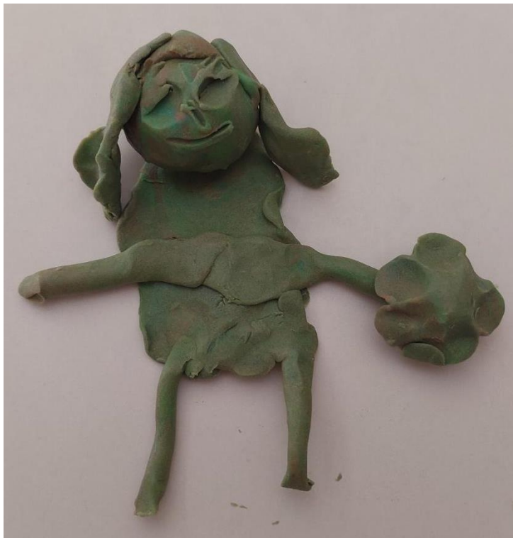
Slika 12: Izdelek plesalke.