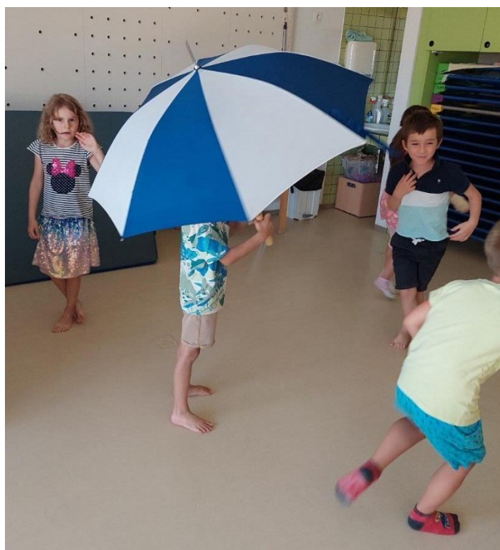
Slika 17: Deček drži dežnik, ostali otroci se gibajo vsak po svoje.