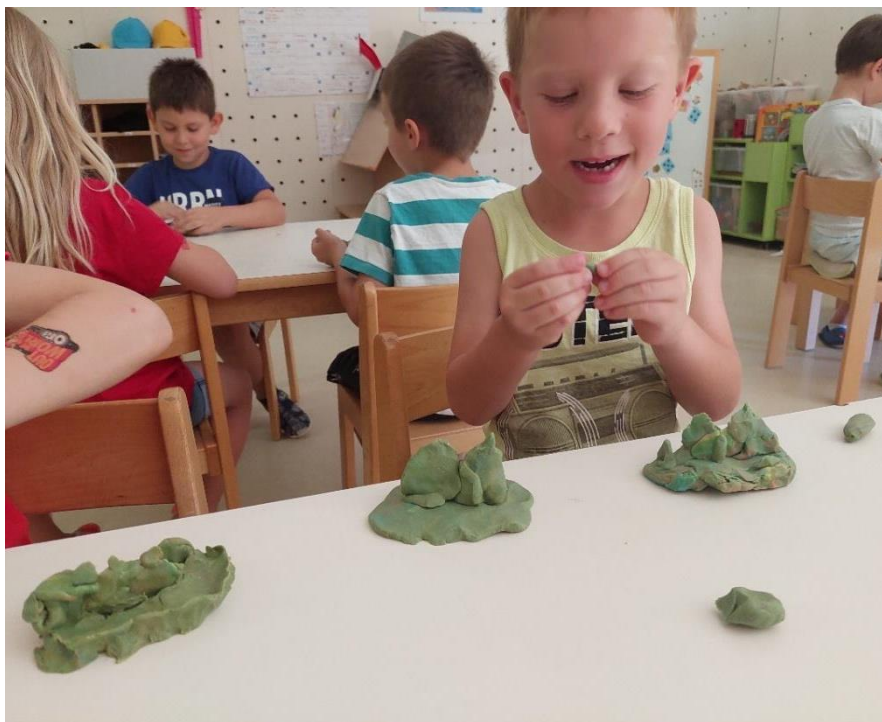
Slika 10: Otroci izdelujejo gradove iz mase.