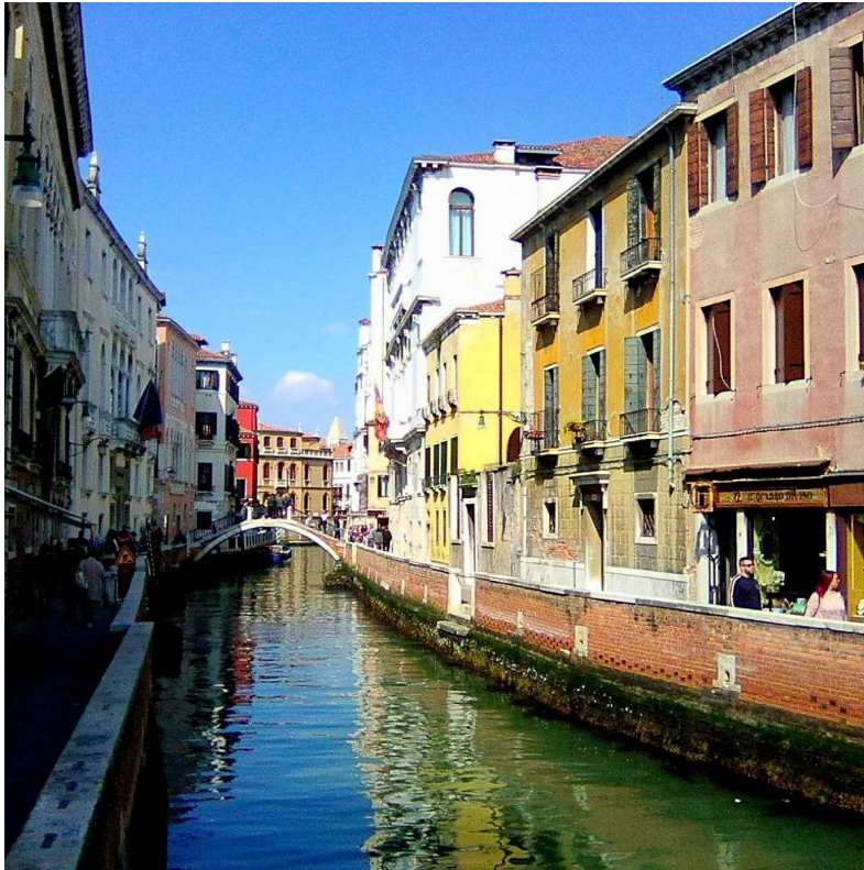
FOTO 7. Rio di San Trovaso