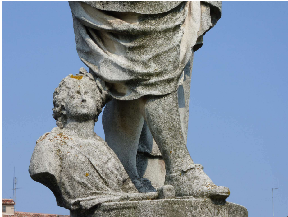
FOTO 5. Busto di Gaspara Stampa a Prato della Valle

ornano il canale perimetrale, il busto della poetessa (foto 5), unica donna fra i settantotto illustri personaggi vissuti entro le mura patavine (Petrarca, Tasso, Galileo, Mantegna...) e qui immortalati. Tuttavia cinque punti almeno si possono segnare sull'arabescata mappa della città lagunare e ricondurre a lei, costituendo essi la filigrana di un percorso che esprime,