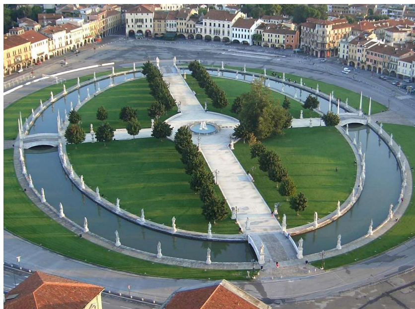
FOTO 4. Prato della Valle, Padova