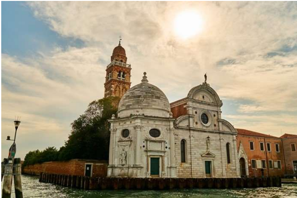
FOTO 10. San Michele