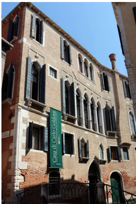
FOTO 11 Casa Goldoni

edificio. Che, pur comportando una robusta deviazione dal principale itinerario della passeggiata, non poteva rimanerne escluso, pena l'ennesi-