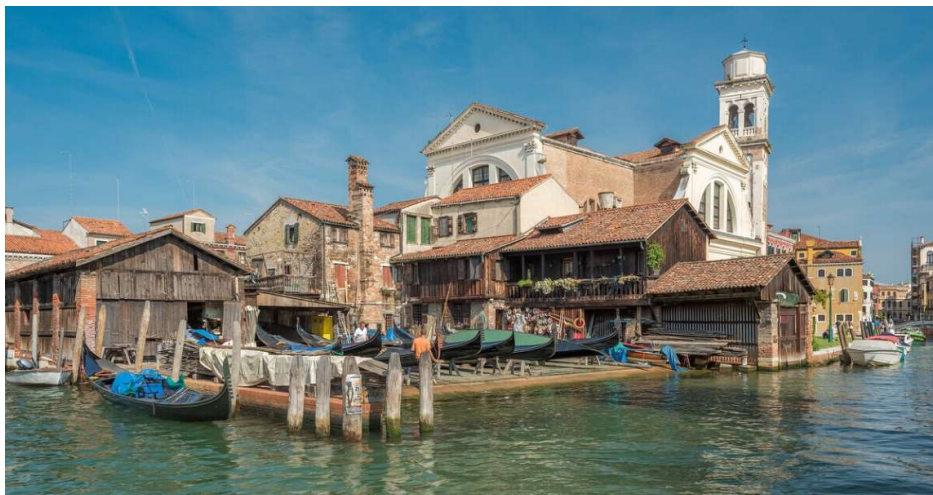
FOTO 8. Squero di San Trovaso