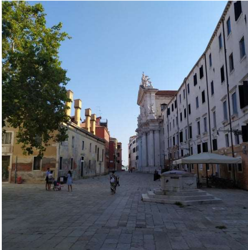
FOTO 14. Campo e Chiesa dei Gesuiti

della vita della poetessa, e sul quale altre e più fortunate ricerche d'archivio dovranno essere condotte. Per il momento, occorre attenersi a queste poche e traballanti ipotesi, ironicamente constatando che sappiamo molto di più, perché Venezia è in tal senso più eloquente, della Stampa amante infelice che non di quella appagata e fiera del suo stato («Ben si convien, signor, che l'aureo dardo / Amor v'abbia aventato in mezzo il petto, / ... / havendo a me col vostro dolce sguardo, / onde piove disir, gioia e diletto, / l'alma impiagata e 'l cor legato e stretto», CCXIX 1-7). E tuttavia è questa, crediamo, l'effigie più rappresentativa della poetessa, ovvero quella che la ritrae in possesso della giusta mercede resa al suo protrato impegno di grande e sapiente amorosa, di finissima intenditrice delle emozioni, e di spericolata esploratrice dello spazio dell'alterità. Questa Gaspara che si sente vista, ammirata e guardata dal suo amante con occhi pieni di desiderio; che si riempie di «gioia e diletto» nell'arco di poco più di una dozzina di componimenti (mentre nelle centinaia per il Collalto