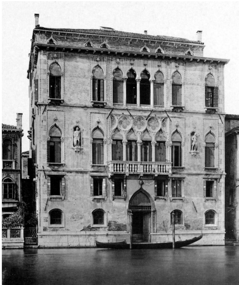
FOTO 15. Palazzo Gozzi

Ritorniamo sul Canal Grande e, allungando di necessità il tragitto, lo attraversiamo varcando di nuovo il ponte di Rialto. Risaliamo quindi verso la chiesa e il campo di Santa Maria Mater Domini nel sestiere di Santa Croce, ricco di abitazioni prestigiose fra le quali, affacciato sullo stesso Canal Grande, il palazzo (dei) Gozzi (foto 15). Mercanti di seta, costoro lo