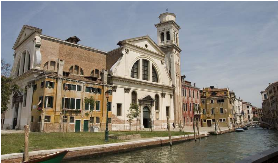
FOTO 6. Chiesa, campo e canale di San Trovaso