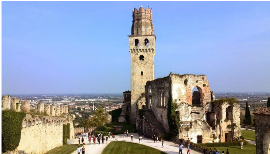
FOTO 2. Castello di San Salvatore, Susegana

vralgici luoghi non veneziani. Fra questi, il diroccato castello di San Salvatore dei conti di Collalto a Susegana (foto 2); l'altrettanto fatiscente ab-