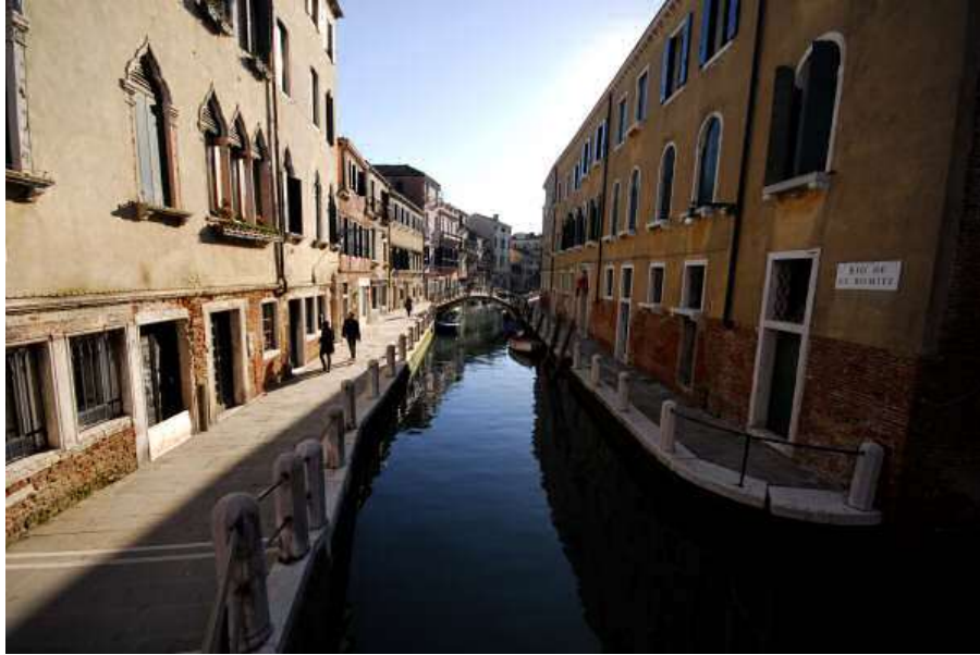
FOTO 1. Rive

te comprendere, oltre a una somma anonima di rive e di calli della città stessa, da lei insistentemente chiamati a testimoni delle proprie emozioni e lungo i quali ancora la si immagina sostare (foto 1), anche alcuni ne-