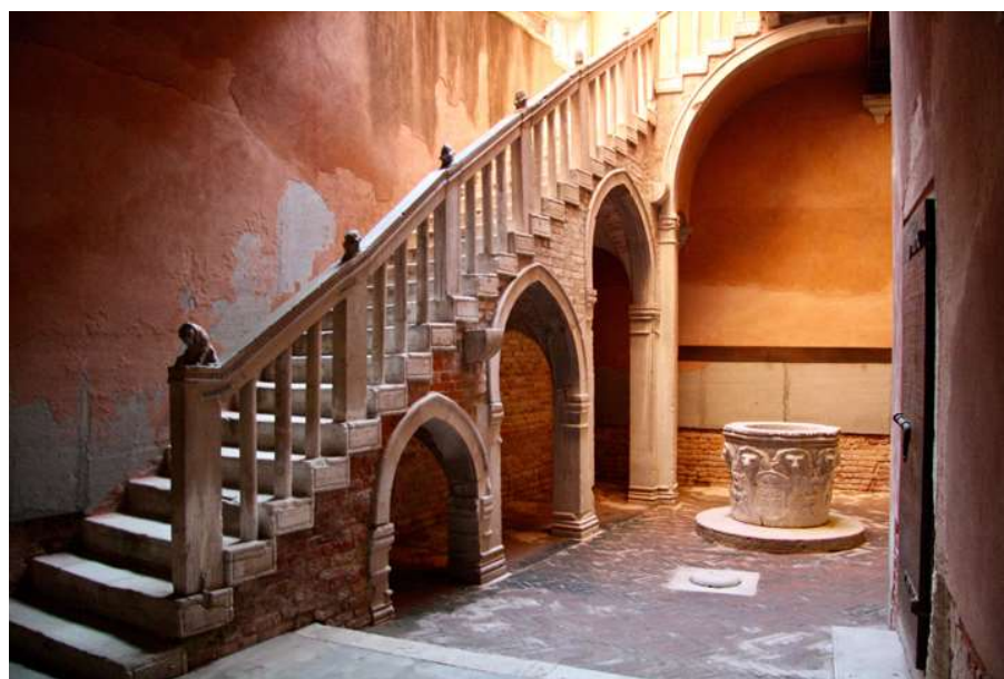
FOTO 12. Casa Goldoni, scala interna