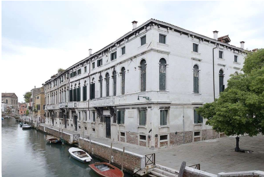
FOTO 13. Palazzo Zen

All'enigma del personaggio si affianca peraltro, e abbastanza inevitabilmente, quello della sua dimora. Che potrebbe essere stata tanto il distrutto palazzo Zen(o) in Riva di Biasio in Santa Croce, incendiato nel 1849 durante l'assedio austriaco, quanto il gotico e omonimo palazzo Zen(o) in San Polo, tuttora di proprietà della casata, quanto ancora (e forse con più probabilità) il sempre omonimo palazzo Zen(o) in Cannaregio, sul rio di Santa Caterina (foto 13), la cui facciata laterale destra è rivolta