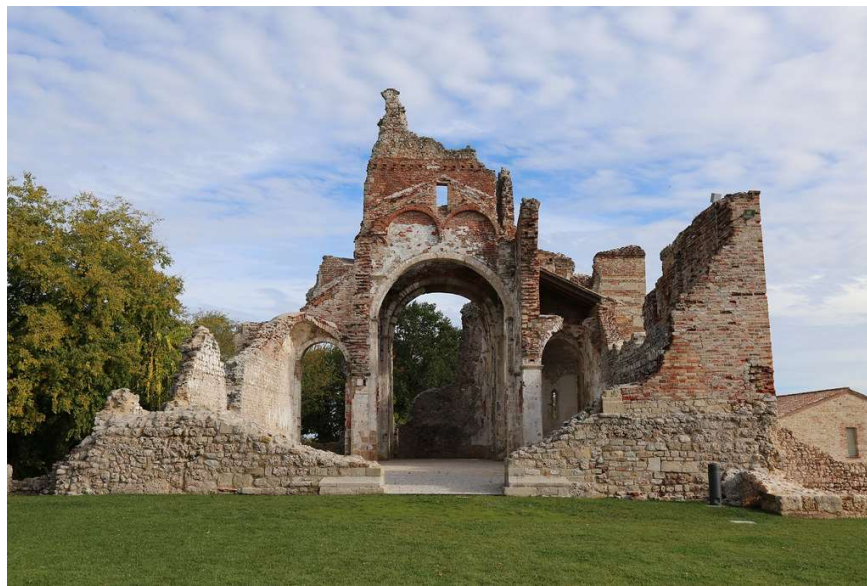
FOTO 3. Abbazia di Sant'Eustachio, Nervesa

bazia di Sant'Eustachio a Nervesa, fondata nel secolo XI dalla famiglia medesima dei Collalto e abbattuta nel corso della prima guerra mondiale (foto 3); il padovano Prato della Valle (foto 4) che annovera, fra le statue che ne