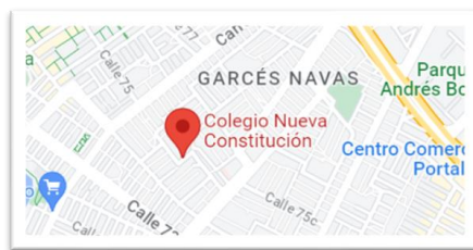
Figura 1. Ubicación Geográfica IED Nueva Constitución

Micro contexto: El curso cuarto del IED Nueva Constitución tiene características en que los niños y niñas están en promedio de edad entre los 8 y 10 años, son de estrato medio, lo que hace referencia que se encuentran en condiciones socioeconómicas óptimas, todos los estudiantes tienen situaciones diferentes a nivel familiar, el total de estudiantes que participaron de manera asertiva en la práctica investigativa fue de un total de 33 estudiantes, entre las prácticas ya sea de manera recreativa o competitiva los niños y niñas practican algún deporte o actividad un sus pasatiempos.