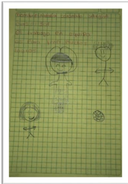
Figura 5. Dibujos hechos por los participantes del estudio investigativo