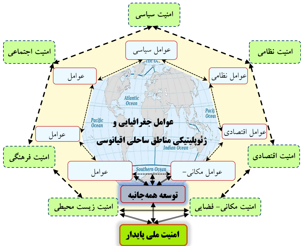
شکل (۱) رابطه عوامل جغرافیایی و ژئوپلیتیکی مناطق ساحلی اقیانوسی و امنیت ملی

این تحقیق را میتوان در زمره تحقیقات بنیادی و کاربردی لحاظ نمود. روش تحقیق در این مقاله توصیفی-تحلیلی است. روش گردآوری داده‌ها در این تحقیق، به هر دو روش کتابخانه‌ای و میدانی است. در روش کتابخانه‌ای از ابزار فیش استفاده شده است. در روش میدانی از ابزارهای مشاهده و پرسشنامه استفاده شده است. پرسشنامه در این تحقیق از نوع محقق ساخته و چند گزینه‌ای است.