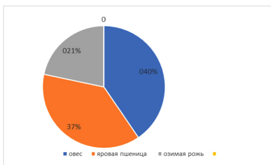
Рис. 2. Основные посевные культуры в Тюменском районе в 1926 году

Основные посевные культуры представлены далее (рис. 2).