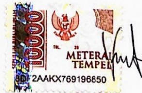
Vivin Veronica Pengestu