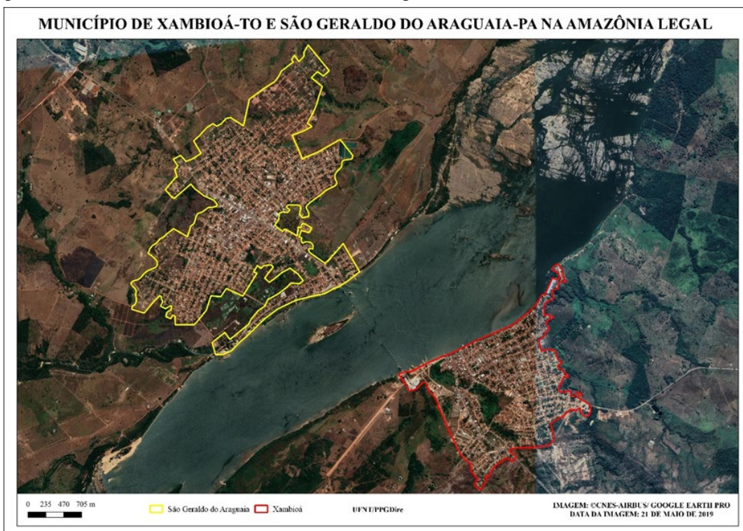
Figura 2: Vista aérea de Xambioá (TO) e São Geraldo do Araguaia (PA)

Data da imagem: 21 maio 2019.