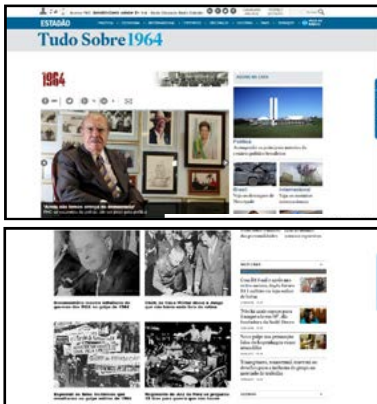
Figura 11 - Tudo sobre 1964.

Agendamento: Na primeira divisão, intitulada “1964” tem-se um quadro randômico com sete matérias: “Choque entre duas visões de Brasil”; “Embaixador dos EUA pediu dinheiro, adido militar e armas para apoiar o golpe”; “Se houvesse confronto, seria um massacre”; “Eu assumi para ser deposto (entrevista com José Sarney)”; “Ainda não temos crença na democracia (entrevista com Fernando Henrique Cardoso)”; “No segredo dos desaparecidos, uma ditadura ainda de pé” e “Nunca fomos tão felizes. Então veio o golpe”. E logo abaixo, mais quatro matérias estáticas. “Documentário mostra influência do governo dos EUA no golpe de 1964”; “Chefe da casa Militar disse a Jango que não havia nada fora da rotina”; “Especial: os fatos históricos que resultaram no golpe militar de 1965” e “Regimento de Juiz de Fora se preparou 18 dias para guerra que não houve” (Figura 11).