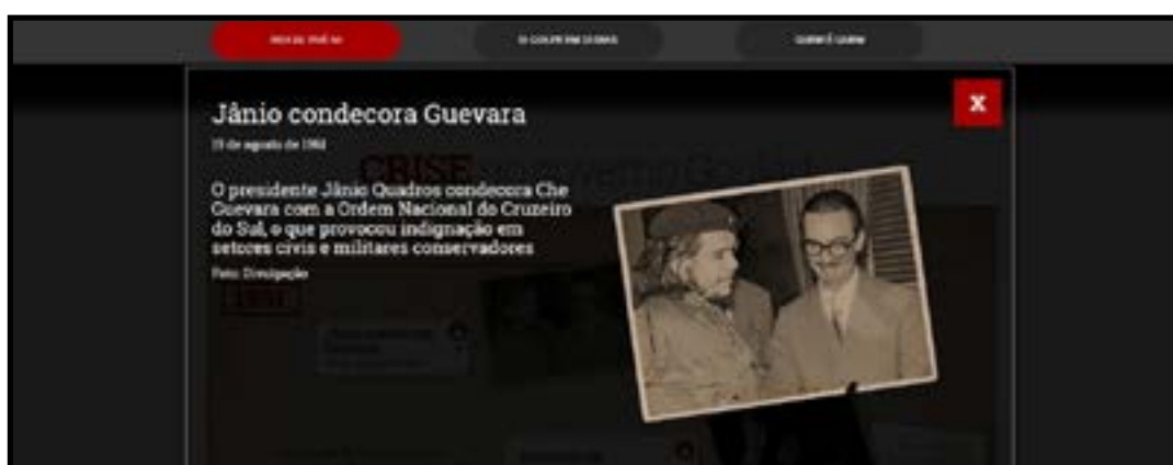
Figura 3 - Jânio condecora Che Guevara (G1).

Enquadramento: A página elenca apenas alguns fatos importantes que aconteceram e corroboraram para que desse início ao processo de tomada do poder. Os fatos apresentados em suma não têm profundidade e por vezes falta informação, como a primeira foto que aparece no infográfico que mostra Jânio condecorando Che-Guevara, não há explicação sobre o porquê da condecoração, somente que o ato causou “indignação” (Figura 3).