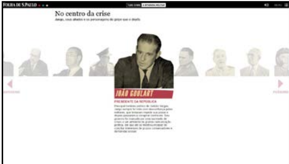
Figura 8 - No centro da crise: Jango e seus aliados.

com mais informações e profundidade, assim também como fatos que não foram abordados pelo concorrente, como a guerrilha do Araguaia (Figura 8 e 9).