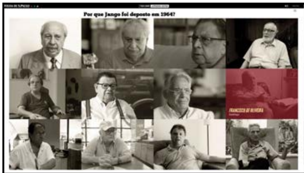
Figura 10 - Mosaico de imagens reais.

entre outros, foram chamados para falar sobre o episódio, o que torna mais dinâmica a absorção do conteúdo, conforme ilustrado na Figura 10.