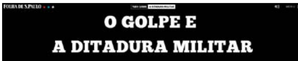
Figura 7 - O Golpe e a Ditadura Militar (Folha de São Paulo).

Agendamento: A proposta da Folha já é diferente do portal analisado anteriormente, pois neste há uma contextualização com o cenário do momento, no qual Dilma enfrentava o repúdio de boa parte da população assim como ocorreu no começo da década de 60 com João Goulart. Há mais elementos gráficos e áudios que elucidam e dão cadência aos fatos apresentados. Além do enfoque para a contextualização, percebe-se uma preocupação do jornal em apresentar os fatos de forma didática, com vídeos explicativos, por exemplo.