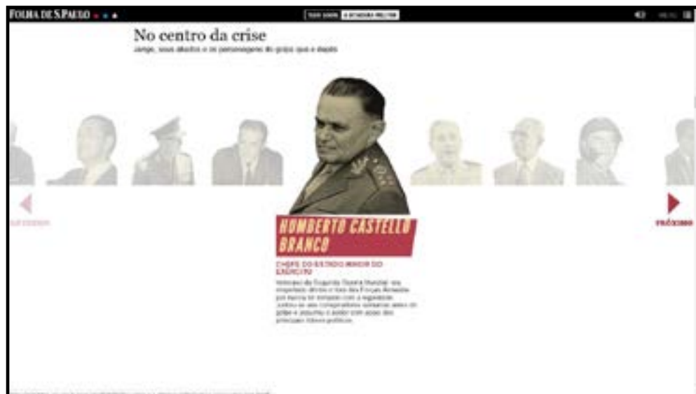
Figura 9 - No centro da crise: Jango e seus aliados: continuação.