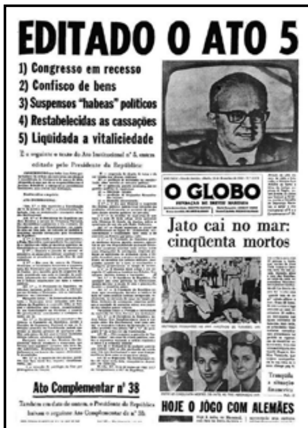
Figura 1 - Ato Institucional nº 5 suspende direitos.