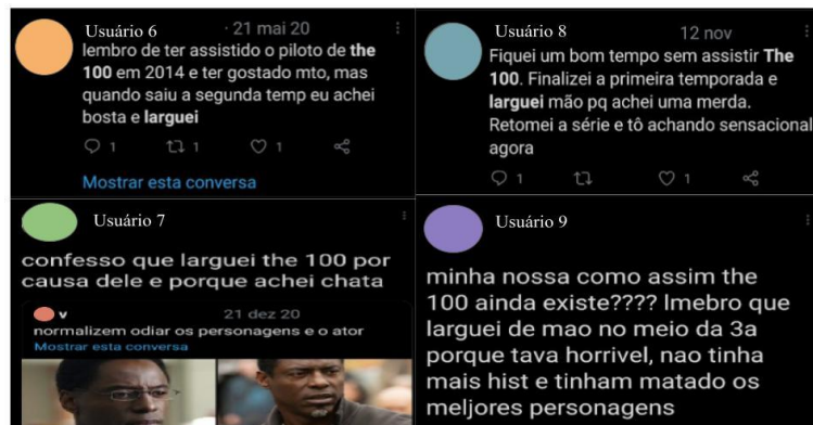
Figura 02 - Postagens na rede social Twitter em relação a história

Os usuários da rede social Twitter também relataram parar de assistir a série devido ao rumo da história, como é demonstrado da figura 02.