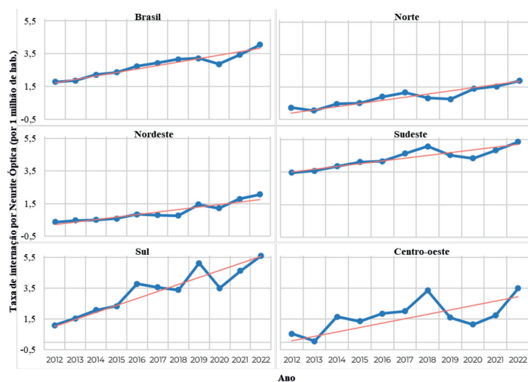
Figura 1 – Taxa de incidência de internação por neurite óptica (por 1 milhão de habitantes) e tendência temporal, segundo região brasileira. 2012-2022.

Fonte: os autores, a partir de dados do DATASUS.