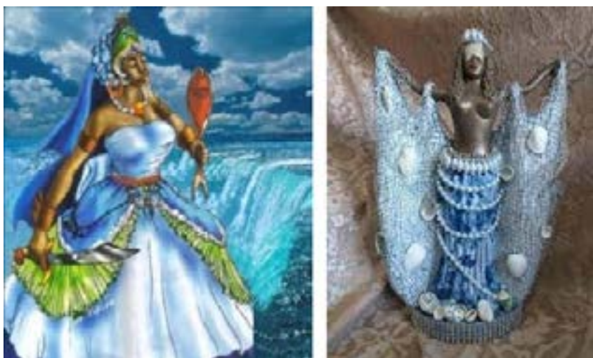
Figura 5: Yemanjá negra

O arquétipo de Yemanjá retratado no espetáculo representa fecundidade e maternidade. Os seios grandes mostram o corpo de uma mãe que amamentou seus filhos, bem como a barriga de grávida mostra a fertilidade feminina. Seus quadris largos, suas coxas grossas e sua pele escura demonstram os traços físicos de mulheres negras, rompendo com a imagem muitas vezes difundida de uma Yemanjá embranquecida, com traços finos e corpo magro.