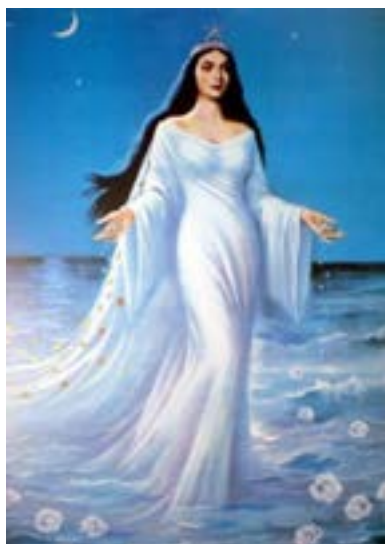
Figura 1: Imagem de Yemanjá branca.