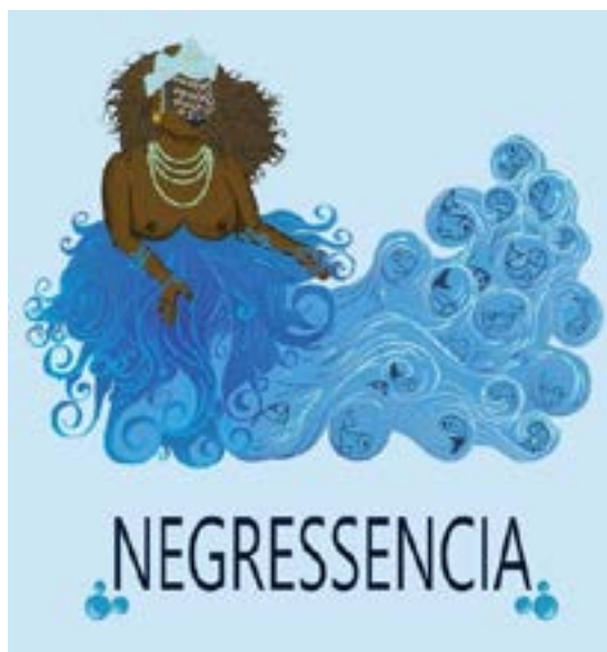
Figura 6: Identidade visual do Projeto Negressencia. (Alexon Pret.A, 2016)

Vejo essa fuga como um reflexo do embranquecimento da categoria mulher negra como um todo e passível de um paralelo com o embranquecimento da imagem de Yemanjá. Esta é uma violência contra toda a ancestralidade negra que compõe o mosaico brasileiro, tendo em vista que se trata de uma divindade que chegou forçadamente no país com as religiões de negros e negras escravizados/as e que passou a ser predominantemente representada aqui como uma mulher branca. Essa violência é tão tipicamente gaúcha quanto uma roda de chimarrão e, para sobrevivermos, sempre tivemos que estar vigilantes, que nos familiarizar com a linguagem e os modos de quem nos oprime, até mesmo adotar esses modos em certos momentos em nome de alguma ilusão de proteção.