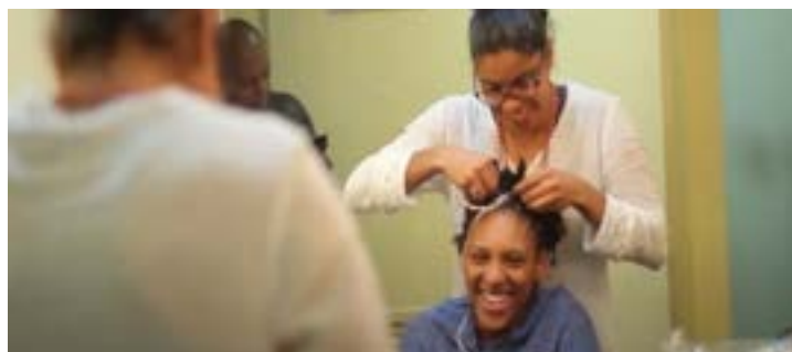
Figura 4: Cena do documentário do Projeto Negressencia

Durante as apresentações do Negressencia, por diversas vezes trançamos o cabelo uma da outra, ajudamos a cuidar dos nossos penteados, compartilhamos cremes específicos para as diferentes texturas de cabelos crespos e cacheados e isso contrastou com as experiências de ter vergonha de, simplesmente, soltar o cabelo na frente de outras pessoas dentro de um camarim.