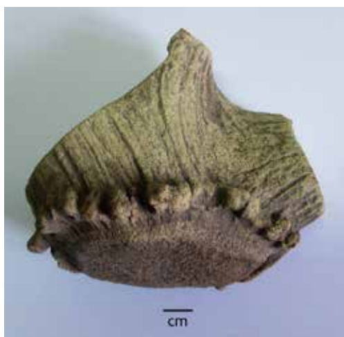
Slika 3. Fragmenti rogova sa tragovima sečenja metalnim alatom, Zok. Bataševo.