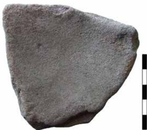
Slika 1. Alatka od abrazivnog kamena – glačalica

predmeti obično se mogu nedvosmisleno razdvojiti. Čak i faunalni ostaci mogu biti od značaja; naime, tragovi kasapljenja na kostima takođe mogu odražavati alat koji je iskorišćen. Haskel Grinfeld naročito se bavio ovom temom, i analizirao je tragove na kostima sa većeg broja lokaliteta koji se datuju u periode pojave metalurgije (e.g., Greenfield 1999; 2000). Pouzdani tragovi korišćenja metalnog alata u većoj meri utvrđeni su za koštane industrije sa nalazišta vučedol-