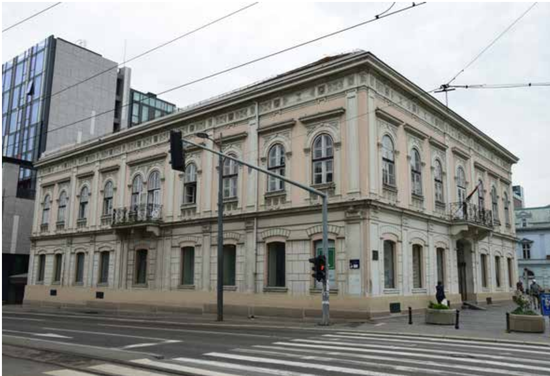
Biblioteka grada Beograda smeštena je u zgradi nekadašnjeg hotela "Srpska kruna". Zgrada je podignuta 1869, od 1981. godine predstavlja nepokretno kulturno dobro kao spomenik kulture.