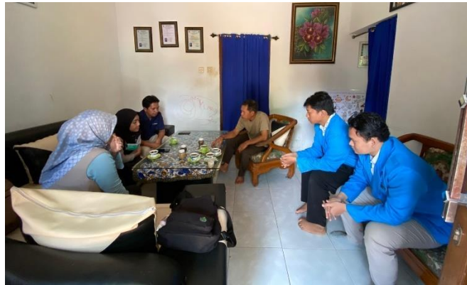
Gambar 3. Kegiatan Diskusi dengan Mitra

efektif. Djuwita, (nd) menyebutkan bahwa komunikasi efektif sangatlah penting dalam suatu organisasi dalam mencapai tujuan organisasi. Berdasarkan hasil komunikasi, diketahui bahwa terdapat permasalahan terkait pengoperasian mesin pengering kopi. Gambar 3 menunjukkan kegiatan diskusi dengan mitra kelompok tani Sumber Kembang yang diwakili oleh ketua Kelompok Tani.