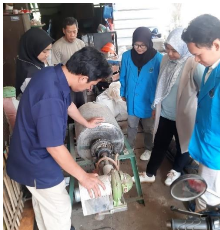
Gambar 4. Pelatihan Mesin Pengering Kopi

Pada tahap kedua dilaksanakan pelatihan pengoperasian mesin pengering kopi. Kegiatan pelatihan yang dilaksanakan oleh tim pelaksana dapat disajikan pada Gambar 4 berikut ini: