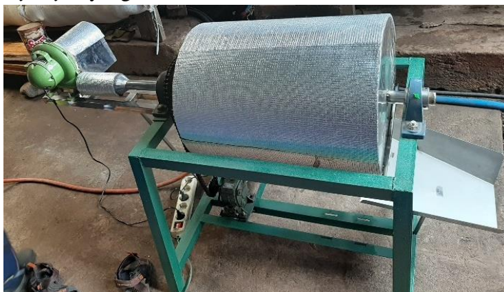
Gambar 1. Mesin Pengering Kopi

Dalam proses produksi kopi salah satu tantangan yang harus dihadapi oleh setiap petani kopi adalah datangnya musim hujan. Inovasi yang telah dimiliki oleh Kelompok tani Sumber Kembang adalah adanya mesin pengering kopi berbasis rotary dryer . Mesin tersebut merupakan salah satu output dari kegiatan masyarakat yang bertujuan untuk mendukung peningkatan kualitas juga kuantitas dari produk olahan kopi. Mahmudati and Tri Indrawati, (2019) dan Aminah dkk , (2022) menyebutkan bahwa adanya mesin pengering kopi berbasis rotary dryer dapat meningkatkan produktivitas usaha. Gambar 1 menunjukkan mesin pengering kopi berbasis rotary dryer yang telah dimiliki mitra: