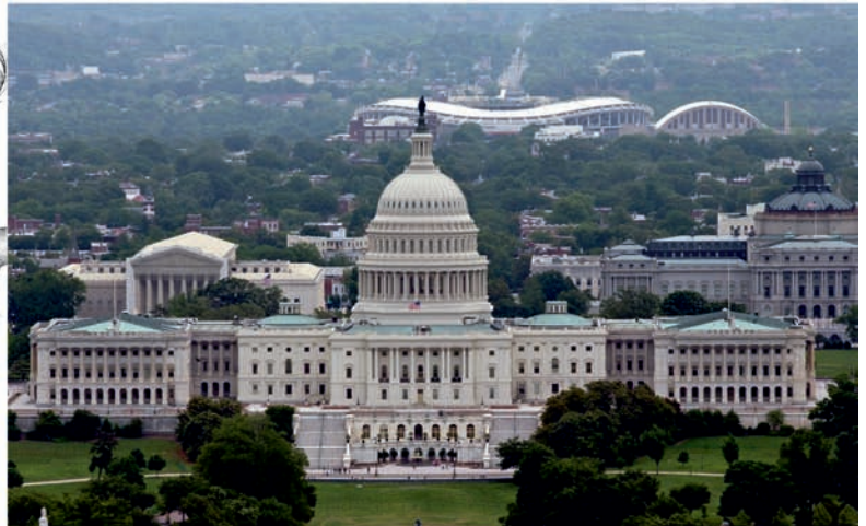
а) б) Рис. 1. Вашингтон: а) план П. Ланфана; б) здание Капитолия