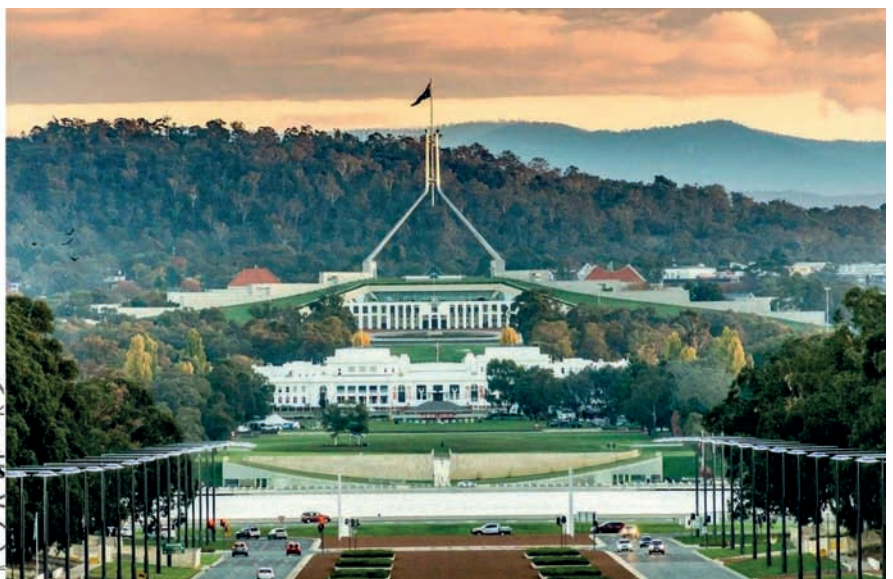
а) б) Рис. 2. Канберра: а) схема генерального плана У. Гриффина; б) здание Парламента