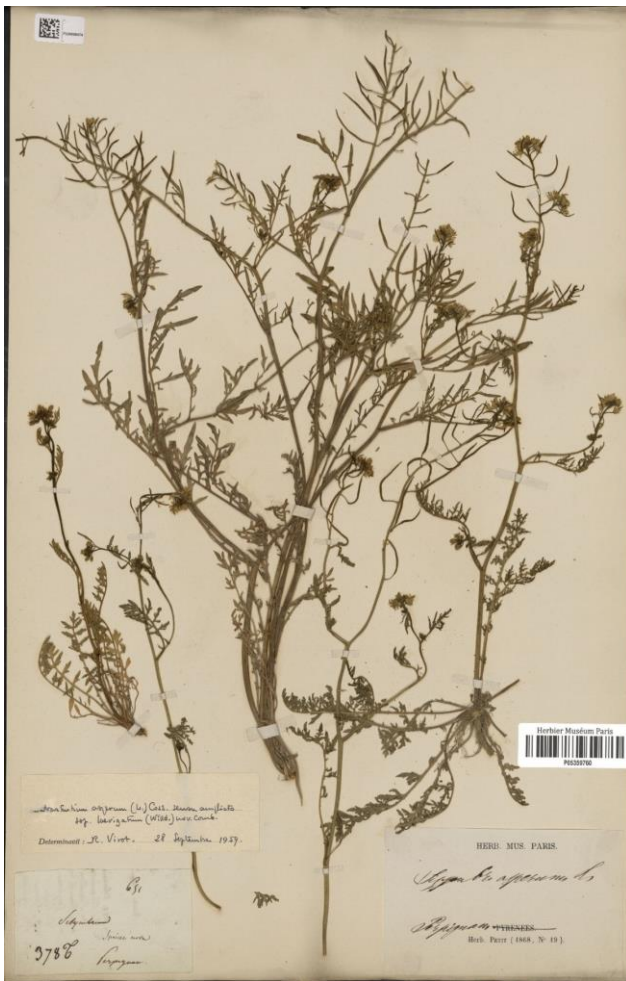
Figura 5. Epitipo de Sisymbrella aspera subsp. praeterita Heywood, P (código de barras P05359760).

Heywood (1964a: 143) propuso el nombre Sisymbrella aspera subsp. praeterita para las plantas a las que se había aplicado erróneamente el nombre Sisymbrium laevigatum , sin aportar diagnosis ni designar tipo, pero haciendo referencia completa y directa a varias publicaciones (Bentham, 1826; Fournier, 1865a; Virot, 1959) que validan el nombre por diagnosis previa (Turland et al. , 2018: Art. 38.1, 38.11, 38.13, 41.7 Nota 3). Según la información que hemos manejado, hasta la fecha este nombre carece de tipo, algo que se aborda en la presente comunicación.