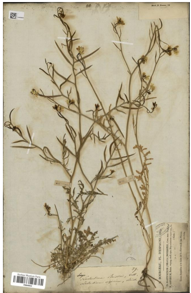
Figura 2. Lectotipo de Nasturtium boissieri Coss., P (código de barras P06649932).

– Lectotypus (hic designatus): [España] Lieux humides à la base de la Sierra de las Nieves, 21 Juin 1849, E. Bourgeau 39, P (código de barras P06649932) (Figura 2). Isolectotypi: BM000750028, K000693333, MPU014130, P05122084, P05122085. – Nombre aceptado: Sisymbrella aspera subsp. boissieri (Coss.) Heywood in Bull. Brit. Mus. (Nat. Hist.), Bot. 1: 107 (1954).