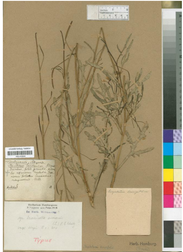
Figura 1. Lectotipo de Sisymbrium laevigatum Willd., HBG (código de barras HBG-505909).

– Nombre aceptado: Diploaxis tenuifolia (L.) DC., Syst. Nat. 2: 632 (1821).