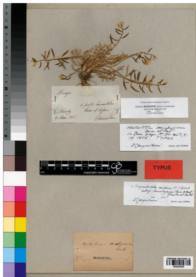
Figura 3. Lectotipo de Nasturtium munbyanum Boiss. & Reut., G (código de barras G00022845).

– Nombre aceptado: Sisymbrella aspera subsp. boissieri .