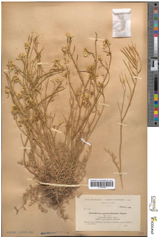
Figura 6. Lectotipo de Sisymbrium pseudoboissieri Degen ex Hervier, LY (código de barras LY0136766).

Hervier (1905: 170) en unas "ADDITIONS" da noticia de que las plantas distribuidas por Elisée Reverchon como " Nasturtium Boissieri Coss." del Barranco de la Valentina en 1904 (con número 1379) y de la de Sierra de Cazorla de 1901 (con número 456), son consideradas por Degen como una especie nueva con el nombre de " Sisymbrium pseudo-Boissieri ", aportando una brevísima diagnosis en francés, " il diffère du type par ses siliques à graines unisériées, etc. ". La diagnosis es suficiente para validar el nombre; si bien, con posterioridad, Hervier (1906: 223) amplió la información. Las indicaciones topográficas de Reverchon no son muy precisas y el Barranco o Barrancón de Valentina debe referirse al río Guadalentín (Lacaita, 1929).