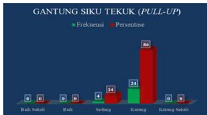
Gambar 3. Grafik Diagram Batang Baring Duduk ( Sit-Up ) pada mahasiswa penjaskesrek STKIP Paris Barantai.

Hasil analisis dari tes pengukuran loncat tegak ( vertical jump ) berdasarkan perhitungan Tes Kesehatan Jasmani Indonesia (TKJI) diperoleh data yang berbentuk nilai, kemudian dikategorikan menjadi 5 (lima) kategori yaitu baik sekali, baik, sedang, kurang, dan kurang sekali. Berikut tabel 6 distribusi frekuensi Tingkat Kesehatan Jasmani pada mahasiswa penjaskesrek STKIP Paris Barantai berdasarkan tes pengukuran loncat tegak ( vertical jump ).