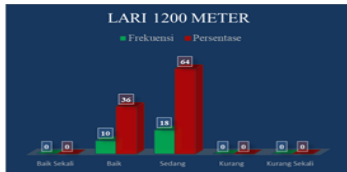
Gambar 5. Grafik Diagram Batang Lari 1200 Meter pada mahasiswa penjas kesrek STKIP Paris Barantai

Berdasarkan tabel di atas dapat dijelaskan bahwa dari 28 putera yang mendapat nilai 5 berjumlah 0 Putera (0%), nilai 4 berjumlah 10 putera (36%), nilai 3 berjumlah 18 putera (64%), nilai 2 berjumlah 0 Putera (0%), dan nilai 1 berjumlah 0 putera (0%). Apabila ditampilkan dalam bentuk grafik diagram batang dapat dilihat pada gambar 5 d bawah ini: