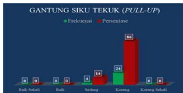
Gambar 2. Grafik Diagram Batang Gantung Siku tekuk ( Pull-Up ) pada mahasiswa penjaskesrek STKIP Paris Barantai.

Berdasarkan tabel di atas dapat dijelaskan bahwa dari 28 Putera yang mendapat nilai 5 berjumlah 0 putera (0%), nilai 4 berjumlah 0 putera (0%), nilai 3 berjumlah 4 putera (14%), nilai 2 berjumlah 24 putera (86%), dan nilai 1 berjumlah 0 putera (0%). Apabila ditampilkan dalam bentuk grafik diagram batang dapat dilihat pada gambar 2 di bawah ini: