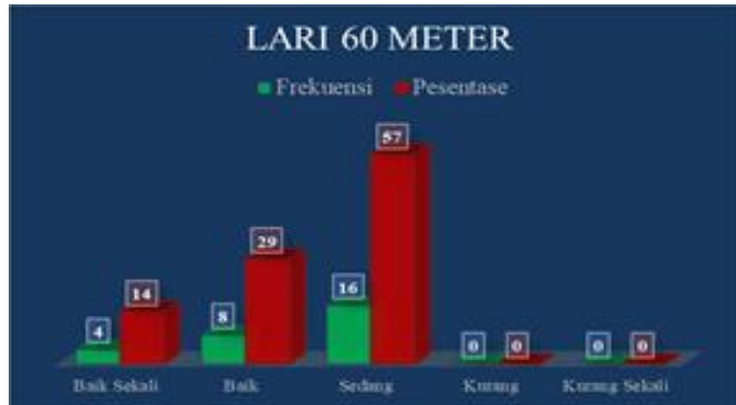
Gambar 1. Grafik Diagram Batang Lari 60 Meter mahasiswa penjaskesrek STKIP Paris Barantai.

Berdasarkan tabel di atas dapat dijelaskan bahwa dari 28 Putera yang mendapat nilai 5 berjumlah 4 putera (14%), nilai 4 berjumlah 8 putera (29%), nilai 3 berjumlah 16 putera (57%), nilai 2 berjumlah 0 putera (0%), dan nilai 1 berjumlah 0 putera (0%). Apabila ditampilkan dalam bentuk grafik diagram batang dapat dilihat pada gambar 1 d bawah ini: