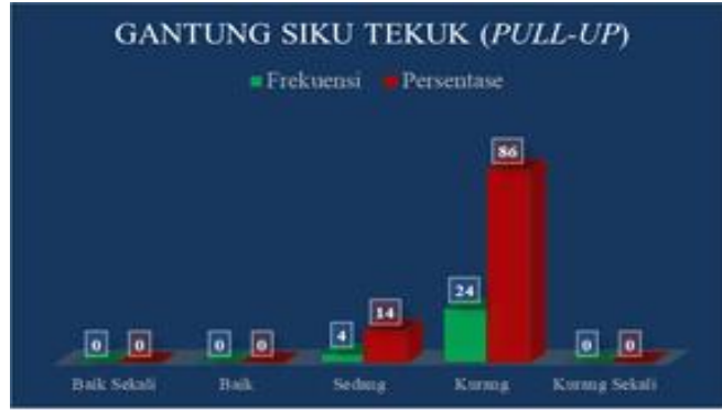
Gambar 4. Grafik Diagram Batang Loncat Tegak ( Vertical Jump ) pada mahasiswa penjas kesrek STKIP Paris Barantai.

Hasil analisis dari tes pengukuran lari 1200 meter berdasarkan perhitungan Tes Kesehatan Jasmani Indonesia (TKJI) diperoleh data yang berbentuk nilai, kemudian dikategorikan menjadi 5 (lima) kategori yaitu baik sekali, baik, sedang, kurang, dan kurang sekali. Berikut table 7 distribusi frekuensi Tingkat Kesehatan Jasmani pada mahasiswa penjas kesrek STKIP Paris Barantai berdasarkan tes pengukuran lari 1200 meter.